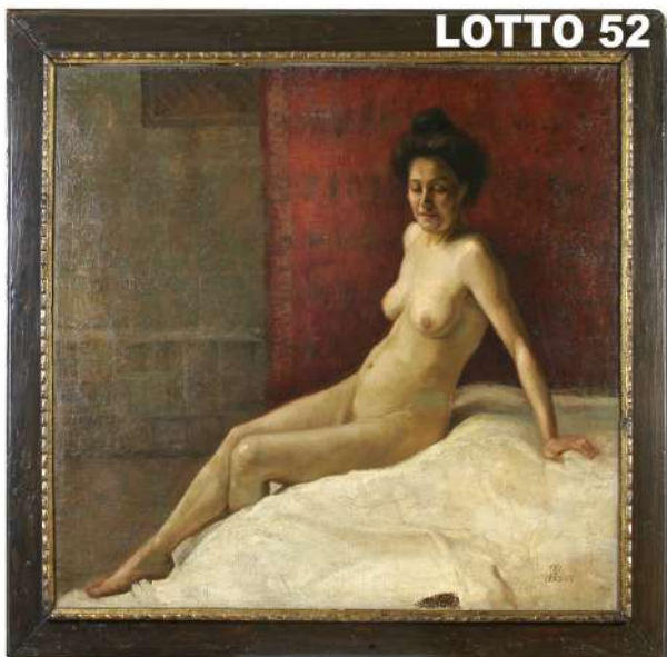
LOTTO 52 MAESTRO ITALIANO FINE XIX°SEC. BASE D'ASTA 2.400,00 / STIMA 4.000 – 4.500 DIPINTO OLIO SU TELA RAFF. NUDO FEMMINILE MIS. 96 X 113 MONOGRAMMATO "L.L." E DATATO 1897 IN BASSO A DESTRA