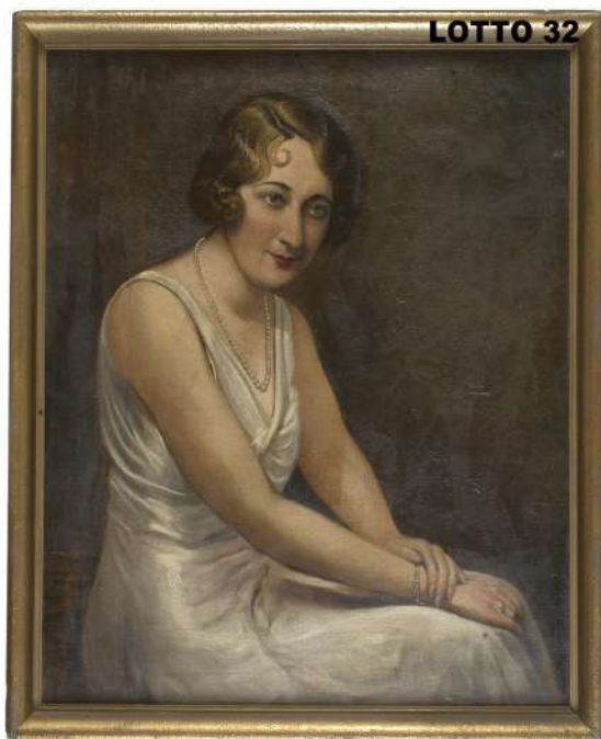
LOTTO 32 MAESTRO ITALIANO INIZI XX° SEC. BASE D'ASTA 480,00 / STIMA 1.000 – 1.200 DIPINTO OLIO SU TELA RAFF. RITRATTO DI RAGAZZA DEGLI ANNI 30 MIS. 80 X 70 MONOGRAMMATO IN BASSO A SINISTRA