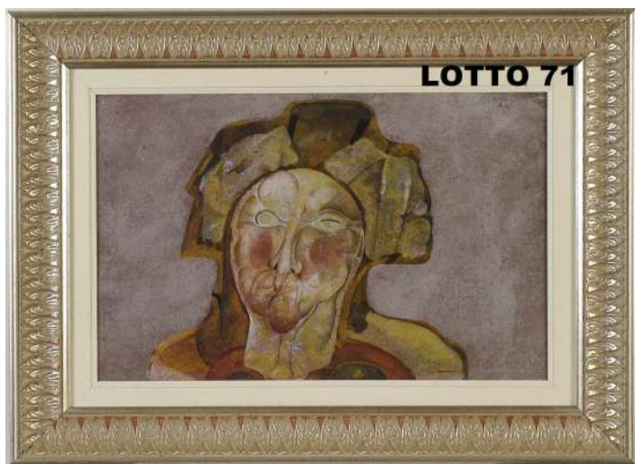
LOTTO 71 ARMODIO (1938) BASE D'ASTA 3.600,00 * / STIMA 6.000 – 7.000 DIPINTO OLIO SU TAVOLA RAFF. VOLTO INFORMALE MIS. 34 X 51 FIRMATO E DATATO 1972 IN BASSO A DESTRA