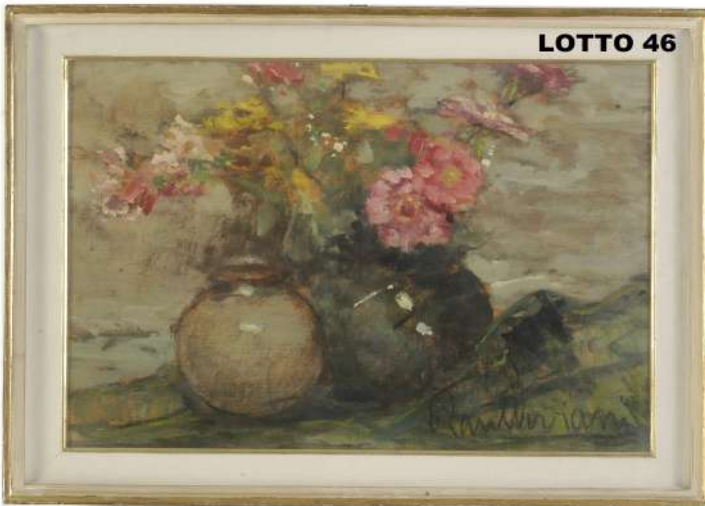
LOTTO 46 RAUL VIVIANI (1883 – 1965) BASE D'ASTA 200,00 / STIMA 900 – 1.000 DIPINTO OLIO SU CARTONE RAFF. VASI DI FIORI MIS. 50 X 70 FIRMATO IN BASSO A DESTRA