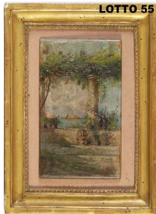
LOTTO 55 VINCENZO IROLLI (1860 – 1949) BASE D'ASTA 600,00 / STIMA 1.800 – 2.000 DIPINTO OLIO SU TAVOLA INTITOLATO "PERGOLATO NAPOLETANO" MIS. 27 X 17 FIRMATO IN BASSO A DESTRA