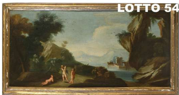
LOTTO 54 MAESTRO VENETO META' DEL XVIII°SEC. BASE D'ASTA 2.400,00 / STIMA 6.000 – 7.000 LOTTO COMPOSTO DA 02 DIPINTI OLIO SU TELA RAFF. PAESAGGI CON PUTTI MIS. 52 X 106