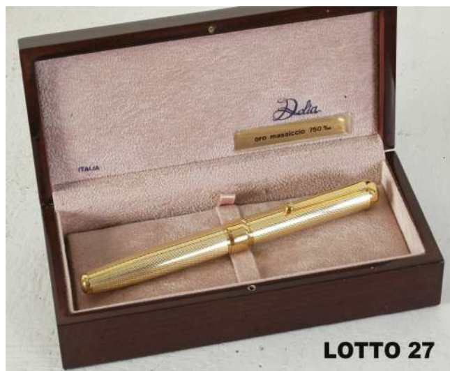
LOTTO 27 DELTA BASE D'ASTA 750,00 / STIMA 1.000 – 1.200 PENNA STILOGRAFICA IN ORO MASSICCIO 750 % 18 KT. MODELLO EVEREST 10 ANNI 60 CORREDATA DA CERTIFICATO DI GARANZIA