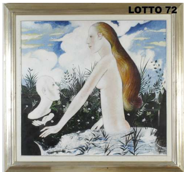
LOTTO 72 BRUNO GRASSI (1944) BASE D'ASTA 300,00 / STIMA 1.500 – 1.600 DIPINTO OLIO SU TELA INTITOLATO "FRAMMENTO E LAGHETTO" MIS. 80 X 90 ANNO 1988 FIRMATO IN BASSO A DESTRA