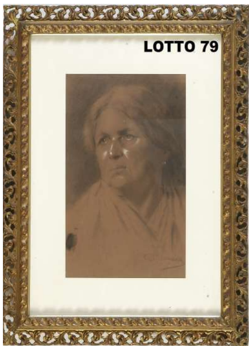
LOTTO 79 DOMENICO MORELLI (1823 – 1901) BASE D'ASTA 150,00 / STIMA 800 – 1.000 DISEGNO CARBONCINO SU CARTA RAFF. VOLTO DI SIGNORA MIS. 41 X 26,5 FIRMATO IN BASSO A DESTRA