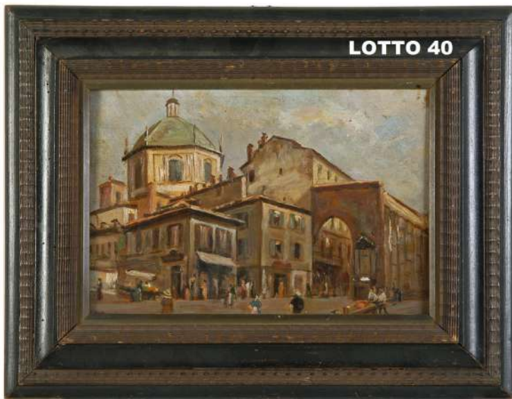
LOTTO 40 M. BERTOLA (INIZI XX° SEC.) BASE D'ASTA 240,00 / STIMA 500 – 600 DIPINTO OLIO SU TAVOLA RAFF. COLONNE DI SAN LORENZO A MILANO MIS. 23 X 34 FIRMATO IN BASSO A SINISTRA