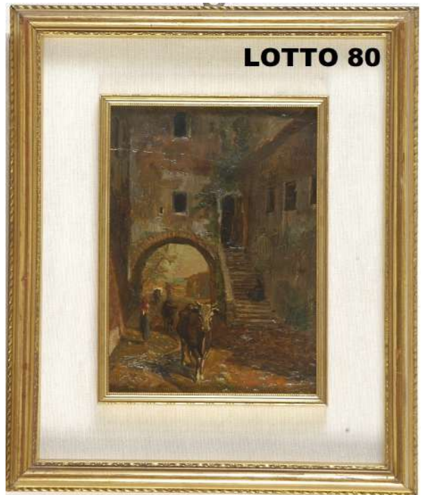
LOTTO 80 ANTONIO FONTANESI (1818 – 1882) BASE D'ASTA 200,00 / STIMA 1.500 – 1.800 DIPINTO OLIO SU TAVOLA RAFF. BORGO DI CAMPAGNA CON CONTADINI MIS. 25 X 18 FIRMATO IN BASSO A SINISTRA