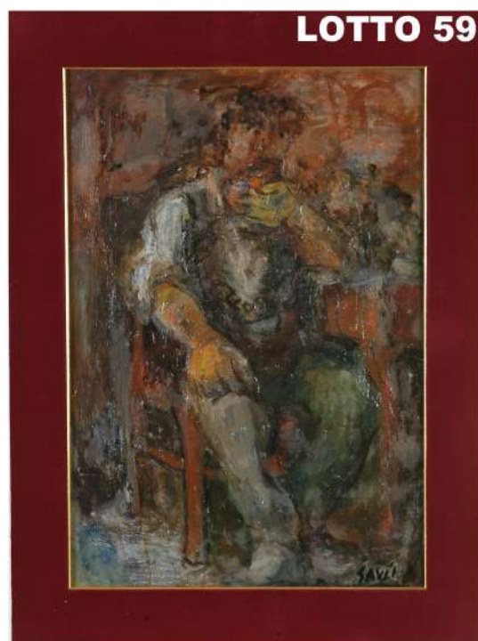
LOTTO 59 PIERO GAULI (1916 – 2012) BASE D'ASTA 150,00 / STIMA 400 – 500 DIPINTO OLIO SU TAVOLA INTITOLATO "BEVITORE" MIS. 59 X 43 ANNO 1947 FIRMATO IN BASSO A DESTRA