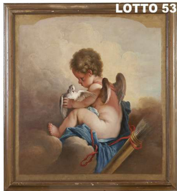
LOTTO 53 MAESTRO ITALIANO INIZI XVIII°SEC. BASE D'ASTA 1.800,00 / STIMA 2.500 – 3.000 DIPINTO OLIO SU TELA RAFF. PUTTO CON COLOMBA MIS. 87 X 87