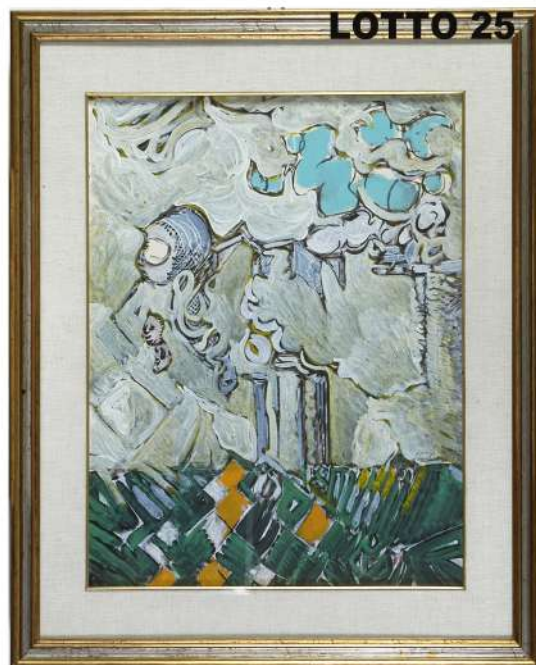
LOTTO 25 LUDOVICO MOSCONI (1928 – 1987) BASE D'ASTA 3.000,00 * / STIMA 4.500 – 5.000 DIPINTO OLIO SU CARTONE TELATO RAFF. ORDALIE MIS. 60 X 50 FIRMATO E DATATO 1968 IN MEZZO A DESTRA