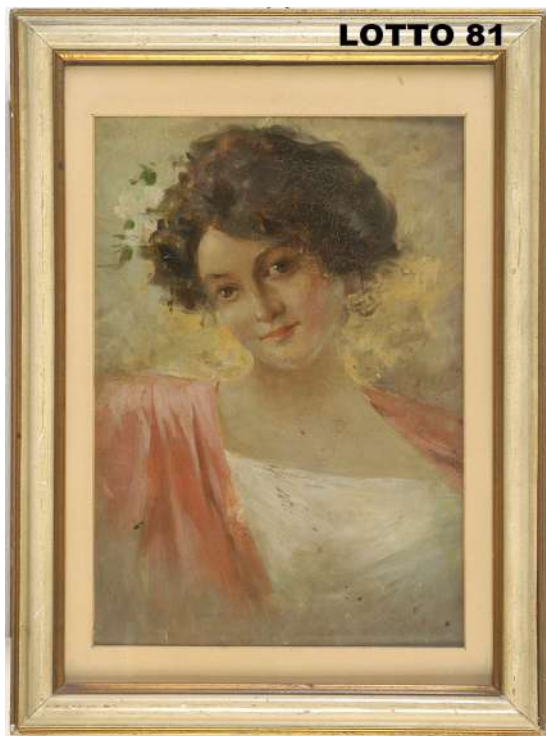
LOTTO 81 MAESTRO XIX° SEC. BASE D'ASTA 200,00 / STIMA 800 – 1.000 DIPINTO OLIO SU TAVOLA RAFF. VOLTO ANCELLA MIS. 46,5 X 28 FIRMATO IN BASSO A DESTRA