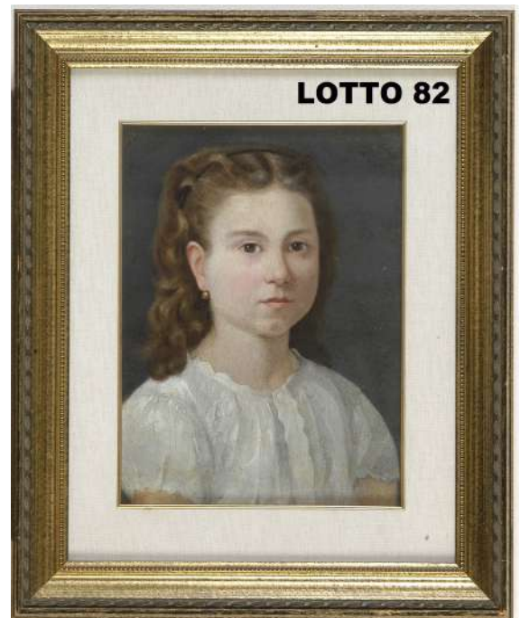
LOTTO 82 MAESTRO XIX° SEC. BASE D'ASTA 200,00 / STIMA 600 – 800 DIPINTO OLIO SU TELA RAFF. RITRATTO DI FANCIULLA MIS. 34 X 26,5