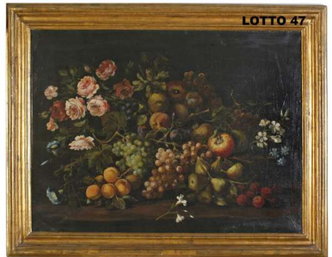
LOTTO 47 SCUOLA DI GILARDO DA LODI (INIZI XVIII° SEC.) BASE D'ASTA 3.250,00 / STIMA 5.500 – 6.000 DIPINTO OLIO SU TELA RAFF. NATURA MORTA DI FRUTTA E FIORI MIS. 72 X 100