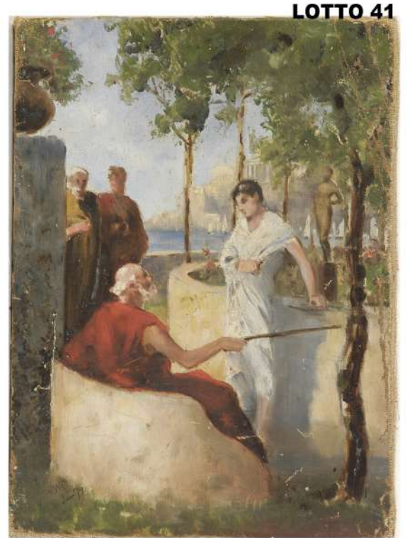
LOTTO 41 FIRMA ILLEGGIBILE (META' XIX° SEC.) BASE D'ASTA 240,00 / STIMA 500 – 600 DIPINTO OLIO SU TELA RAFF. SCUOLA DI SENECA MIS. 39 X 31 FIRMATO E DATATO 1879 IN BASSO A SINISTRA