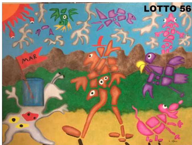
LOTTO 56 LORIS CHESI (1977) BASE D'ASTA 350,00 / STIMA 800 – 1.000 DIPINTO OLIO SU TELA INTITOLATO "ULTIMA SPERANZA IN UN MONDO IN FRANTUMI" MIS. 80,4 X 60 ANNO 2020 FIRMATO IN BASSO A DESTRA