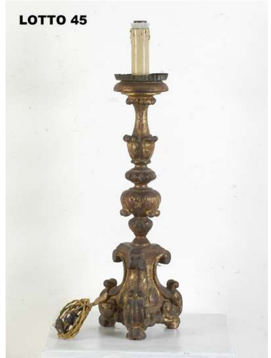
LOTTO 45 BASE D'ASTA 50,00 / STIMA 150 – 200 CANDELABRO IN LEGNO DORATO H. 52 EPOCA LUIGI XIV° FINE DEL XVII° SEC.