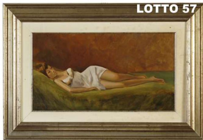
LOTTO 57 ERNESTO GIACOBBI (1891 – 1964) BASE D'ASTA 300,00 / STIMA 700 – 800 DIPINTO OLIO SU TAVOLA RAFF. RITRATTO DI DONNA DISTESA MIS. 27 X 50 FIRMATO IN BASSO A SINISTRA