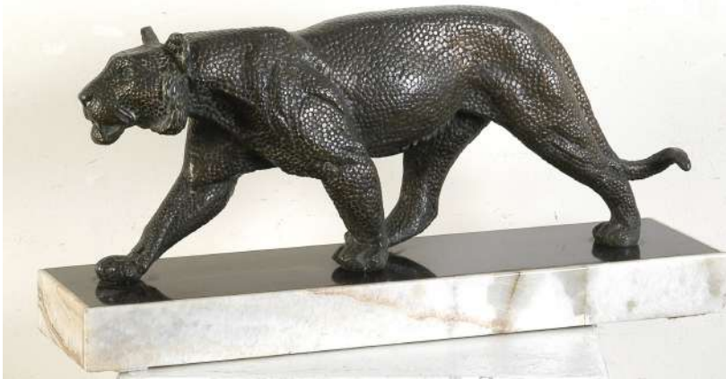
LOTTO 44 RULAS (1930) BASE D'ASTA 720,00 / STIMA 1.500 – 1.800 SCULTURA IN BRONZO RAFF. PANTERA MIS. 53 X 20 FIRMATA SULLA BASE