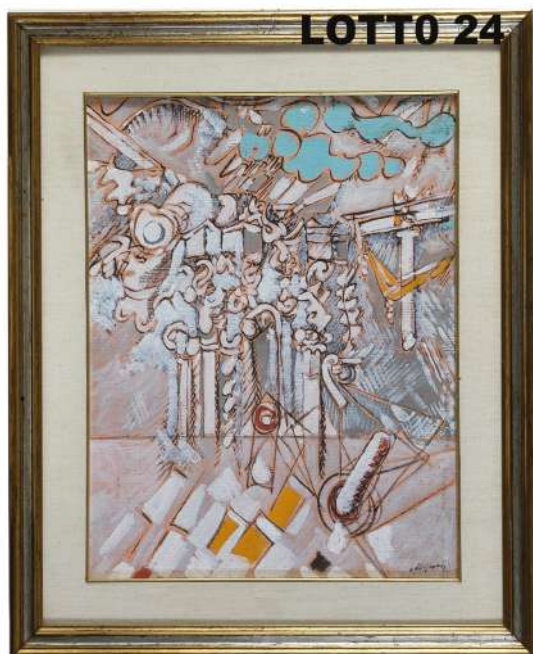
LOTTO 24 LUDOVICO MOSCONI (1928 – 1987) BASE D'ASTA 3.000,00 * / STIMA 4.500 – 5.000 DIPINTO OLIO SU CARTONE TELATO RAFF. ORDALIE MIS. 54 X 43 FIRMATO IN BASSO A DESTRA