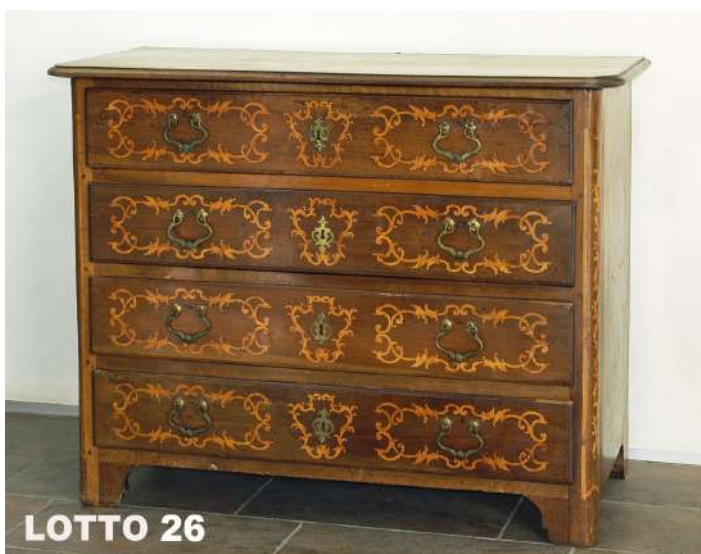
LOTTO 26 BASE D'ASTA 2.800,00 / STIMA 4.500 – 5.000 CASSETTONE A 4 CASSETTI IN LEGNO DI NOCE INTARSIATO IN LEGNO DI BOSSO MIS. 68 X 130 H. 100 PIEMONTE EPOCA INIZI XVIII° SEC.