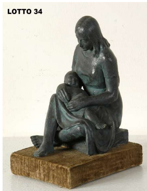
LOTTO 34 VITTORE CALLEGARI (1909 – 1977) BASE D'ASTA 150,00 / STIMA 500 – 600 SCULTURA IN TERRACOTTA PATINATA RAFF. MATERNITA' MIS. 16 X 9 H. 21 FIRMATA E DATATA 1939 A RETRO