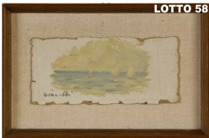
LOTTO 58 ERNESTO GIACOBBI (1891 – 1964) BASE D'ASTA 60,00 / STIMA 150 – 200 DIPINTO OLIO SU CARTONE RAFF. MARINA CON BARCHE MIS. 9 X 21 FIRMATO IN BASSO A SINISTRA