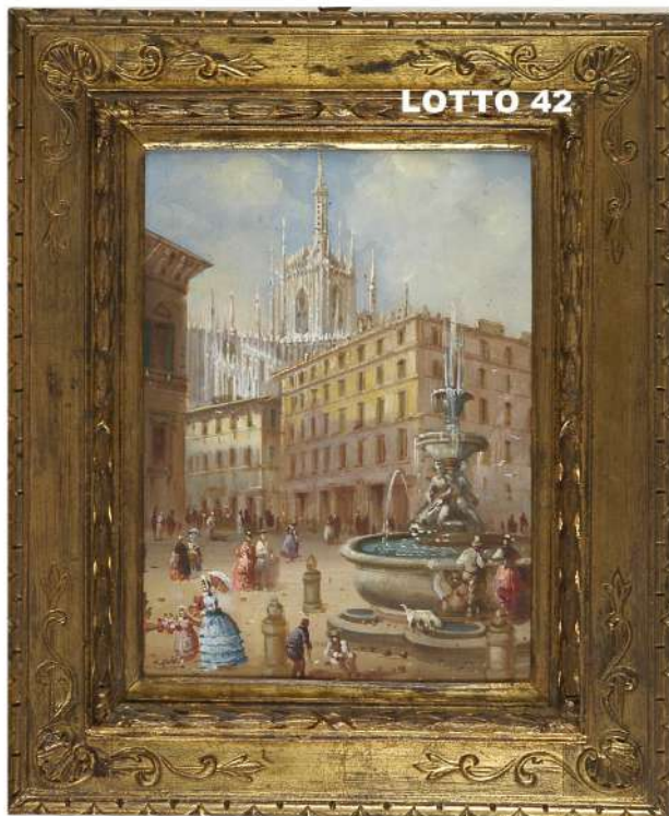
LOTTO 42 GUIDO GUIDI (1835 – 1918) BASE D'ASTA 240,00 / STIMA 1.000 – 1.200 DIPINTO OLIO SU TAVOLA RAFF. PIAZZA A MILANO MIS. 39 X 28 FIRMATO IN BASSO A SINISTRA