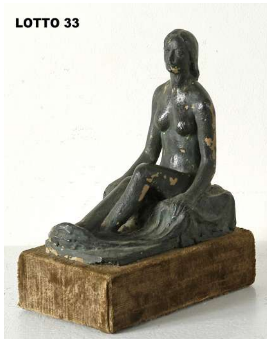
LOTTO 33 VITTORE CALLEGARI (1909 – 1977) BASE D'ASTA 150,00 / STIMA 500 – 600 SCULTURA IN TERRACOTTA PATINATA RAFF. FIGURA FEMMINILE MIS. 18 X 10 H. 18