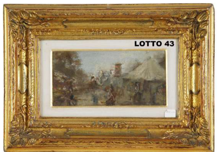
LOTTO 43 PAOLO SALA (1859 – 1924) BASE D'ASTA 240,00 / STIMA 1.400 – 1.500 DIPINTO OLIO SU TAVOLA INTITOLATO "LA FIERA DI PORTA GENOVA" MIS. 11 X 22 FIRMATO IN BASSO A SINISTRA