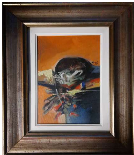
LOTTO 61 GUIDO MAGGI (1925) BASE D'ASTA 250,00 DIPINTO OLIO SU TELA RAFF. INFORMALE MIS. 30 X 20 ANNO 1974 FIRMATO SUL LATO DESTRO