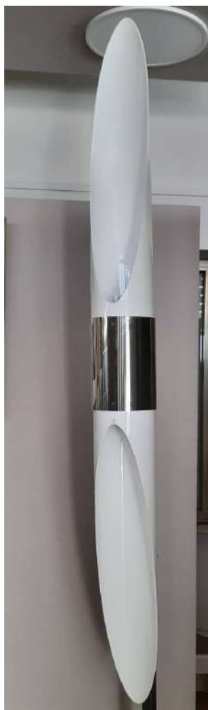
LOTTO 47 KUNDALINI BASE D'ASTA 650,00 LAMPADA A SOSPENSIONE MODELLO "SHAKTI SKY" LARGH. 250 DIAM. 16