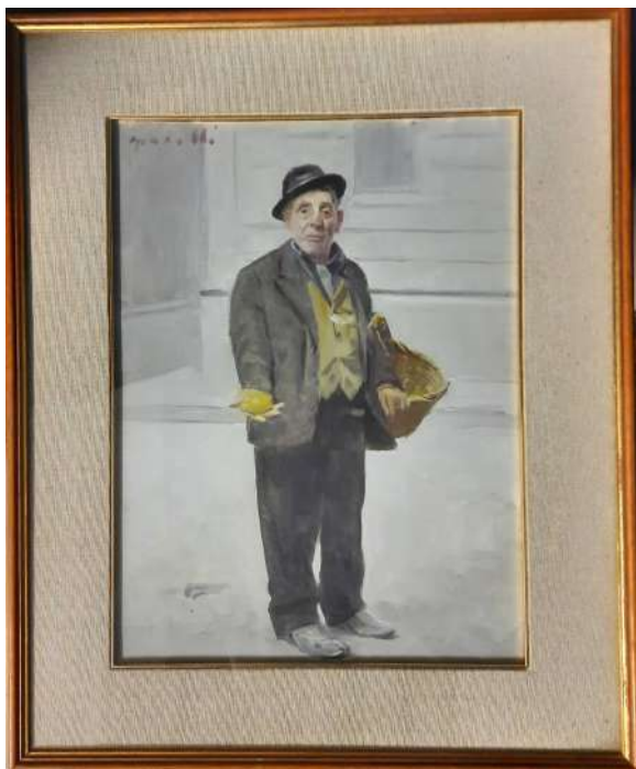
LOTTO 72 ERNESTO GIACOBBI (1891 – 1964) BASE D'ASTA 250,00 DIPINTO OLIO SU TELA RAFF. CIOTTI LIMON MIS. 40 X 30 FIRMATO IN ALTO A SINISTRA