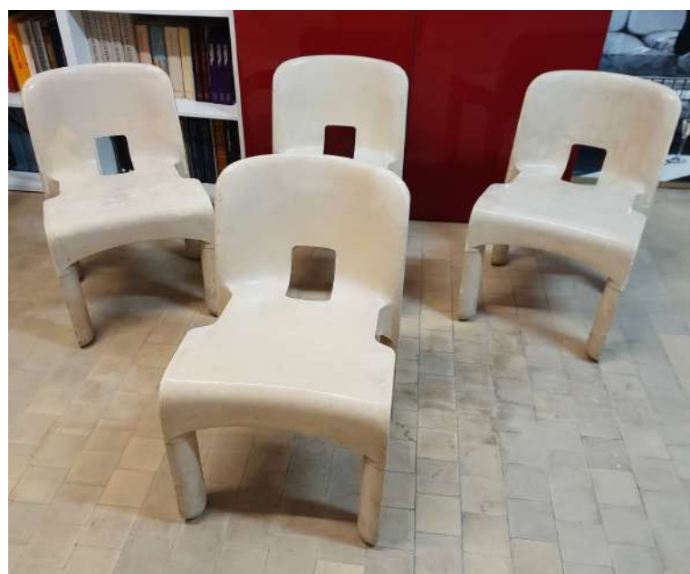
LOTTO 50 JOE COLOMBO (1930 – 1971) BASE D'ASTA 250,00 LOTTO COMPOSTO DA 04 SEDIE PER KARTELL MODELLO "4867" IN POLIPROPILENE BIANCO PANNA MIS. 42 X 50 H. 71 TIMBRATE SOTTO PRODOTTE DA KARTELL NEGLI ANNI 70 E DISEGNATE DA JOE COLOMBO NEL 1967