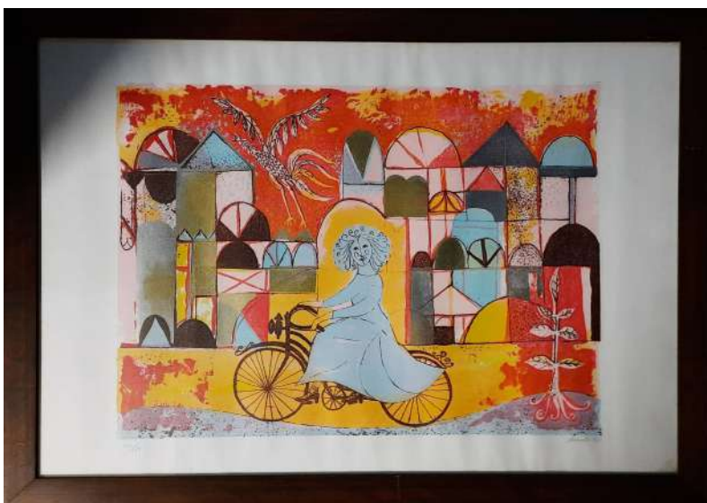
LOTTO 74 CINELLO LOSI (1928 – 1982) BASE D'ASTA 100,00 LITOGRAFIA RAFF. RAGAZZA IN BICICLETTA MIS. 50 X 70 SIGLATA 140 / 170 FIRMATA E DATATA 1967 IN BASSO A DESTRA