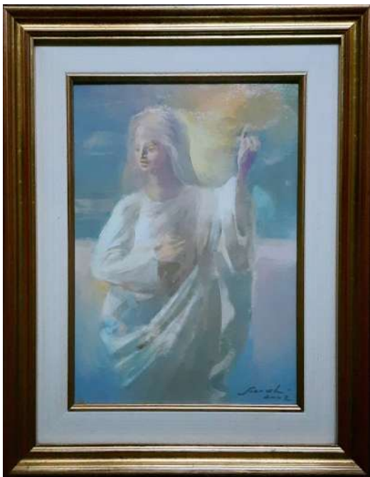
LOTTO 35 CARLO SCROCCHI (1938 – 2012) BASE D'ASTA 50,00 DIPINTO OLIO SU TAVOLA RAFF. MADONNA MIS. 35 X 25 FIRMATO E DATATO 2002 IN BASSO A DESTRA