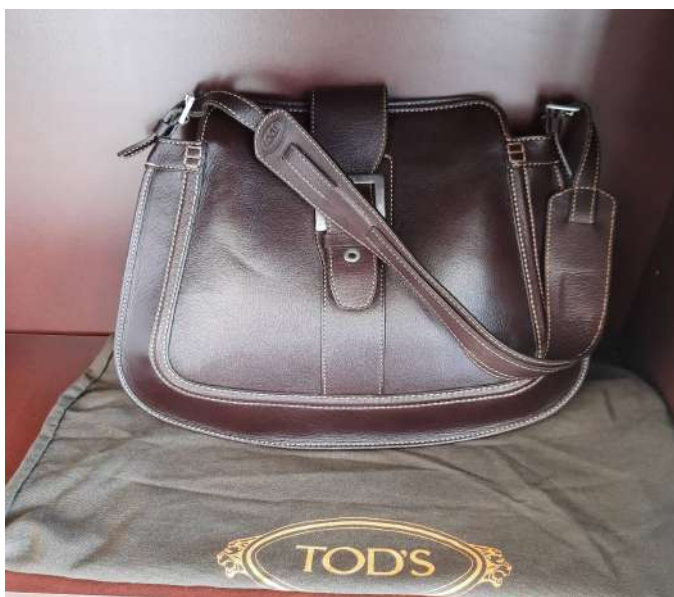
LOTTO 10 TOD'S BASE D'ASTA 250,00 BORSA IN PELLE MARRONE ITALIA ANNI 2015/2020