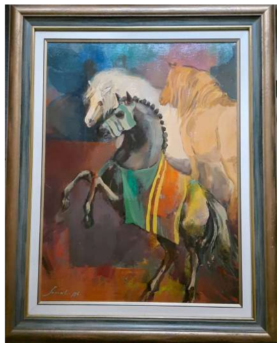
LOTTO 25 CARLO SCROCCHI (1938 – 2012) BASE D'ASTA 100,00 DIPINTO OLIO SU TELA RAFF. CAVALLI MIS. 60 X 45 FIRMATO E DATATO 1996 IN BASSO A SINISTRA