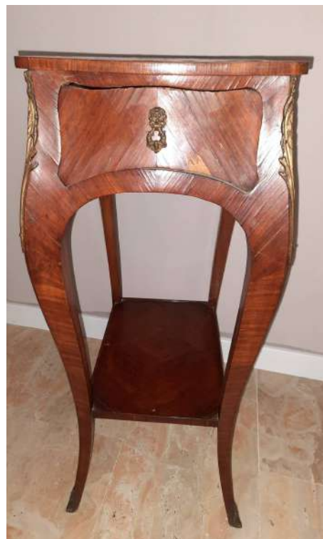
LOTTO 93 BASE D'ASTA 250,00 TAVOLINO NAPOLEONE III° LASTRONATO ED INTARSIATO IN BOIS DE ROSE MIS. 35 X 41 H. 68 FRANCIA FINE XIX°SEC.