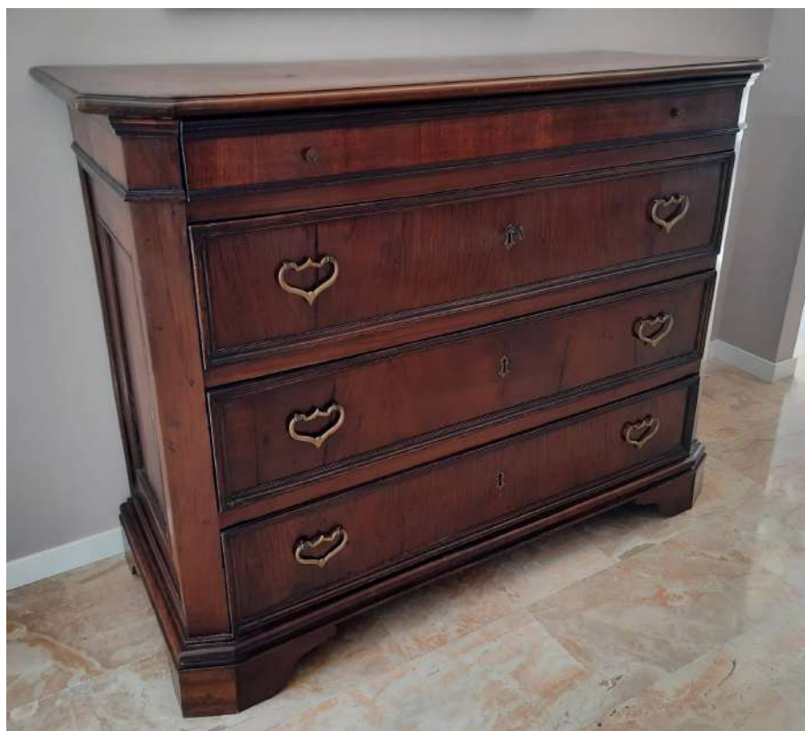
LOTTO 95 BASE D'ASTA 1.250,00 CASSETTONE A 3 CASSETTI E MEZZO IN LEGNO DI NOCE MASSELLO MIS. 153,5 X 59 H. 106 LOMBARDIA FINE XVII°SEC.