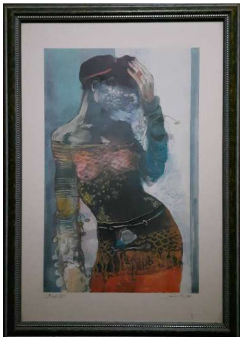
LOTTO 29 CARLO SCROCCHI (1938 – 2012) BASE D'ASTA 80,00 STAMPA INTITOLATA "DEFILE" MIS. 50 X 35 FIRMATA E DATATA 1998 IN BASSO A DESTRA