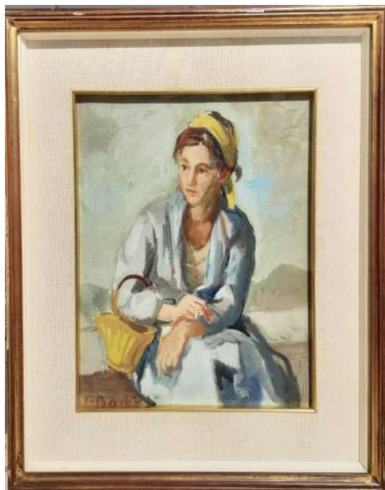
LOTTO 89 CONTARDO BARBIERI (1900 – 1966) BASE D'ASTA 500,00 DIPINTO OLIO SU TELA RAFF. CONTADINA CON CESTINO MIS. 35 X 50 FIRMATO IN BASSO A SINISTRA