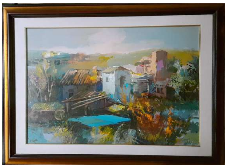
LOTTO 31 CARLO SCROCCHI (1938 – 2012) BASE D'ASTA 200,00 DIPINTO OLIO SU TELA RAFF. PAESAGGIO COLLINARE CON CASEGGIATO MIS. 60 X 80 FIRMATO E DATATO 1993 IN BASSO A DESTRA