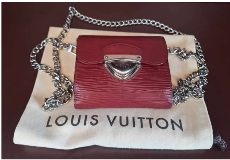
LOTTO 08 LOUIS VUITTON BASE D'ASTA 350,00 PORTAFOGLIO IN PELLE BORDEAUX CON CATENELLA PARIS ANNI 2015/2020