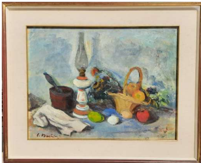
LOTTO 87 CONTARDO BARBIERI (1900 – 1966) BASE D'ASTA 600,00 DIPINTO OLIO SU TAVOLA RAFF. NATURA MORTA CON FRUTTA E LAMPADA MIS. 50 X 65 FIRMATO IN BASSO A SINISTRA