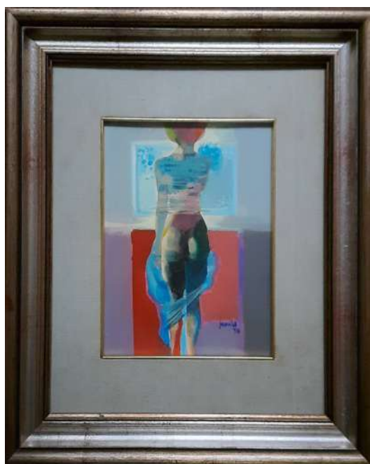
LOTTO 52 CARLO SCROCCHI (1938 – 2012) BASE D'ASTA 80,00 DIPINTO OLIO SU CARTONE TELATO RAFF. NUDO DI SCHIENA MIS. 25 X 21 FIRMATO E DATATO 1975 IN BASSO A DESTRA