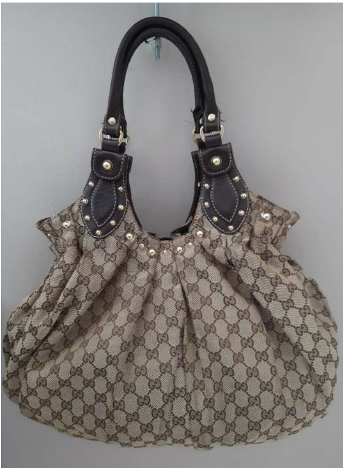
LOTTO 96 GUCCI BASE D'ASTA 400,00 BORSA MODELLO "PELHAM" IN TESSUTO MONOGRAMMATO "GG" BEIGE CON BORCHIE ITALIA ANNI 2010 - 2015