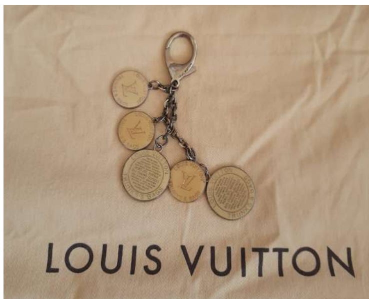
LOTTO 16 LOUIS VUITTON BASE D'ASTA 450,00 ACCESSORIO BORSA/PORTACHIAVI CON MEDAGLIETTE PARIS ANNI 2020