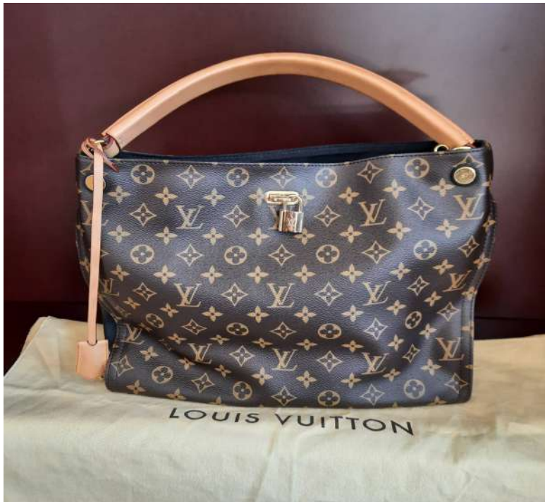
LOTTO 15 LOUIS VUITTON BASE D'ASTA 1.750,00 BORSA "HOBO MONOGRAM NOIR GAIA CON LUCCHETTO ARTSY" PARIS ANNI 2020