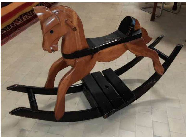
LOTTO 103 BASE D'ASTA 160,00 CAVALLO A DONDOLO IN LEGNO MIS. 115 X 42 H. 63 EPOCA META' XX°SEC.