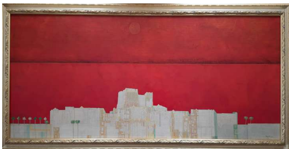
LOTTO 18 CARLO BERTE' (1939) BASE D'ASTA 2.200,00 DIPINTO OLIO SU TAVOLA RAFF. CITTA' MIS. 41 X 100 FIRMATO E DATATO 2002 IN BASSO A DESTRA