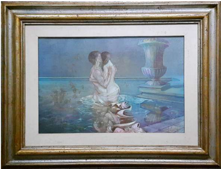
LOTTO 55 WALTER FALCONI (1935) BASE D'ASTA 200,00 DIPINTO ACRILICI SU TELA INTITOLATO "NELLA PISCINA" MIS. 35 X 50 ANNO 1979 FIRMATO IN BASSO A DESTRA