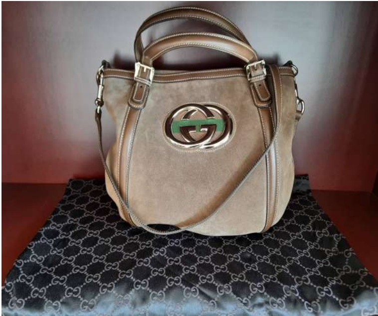
LOTTO 11 GUCCI BASE D'ASTA 625,00 BORSA IN CAMOSCIO VERDE CON INSERTI IN PELLE ITALIA ANNI 2015/2020