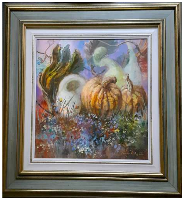
LOTTO 27 CARLO SCROCCHI (1938 – 2012) BASE D'ASTA 100,00 DIPINTO OLIO SU TAVOLA RAFF. NATURA MORTA CON ZUCCHE MIS. 40 X 40 FIRMATO E DATATO 2000 IN BASSO A DESTRA