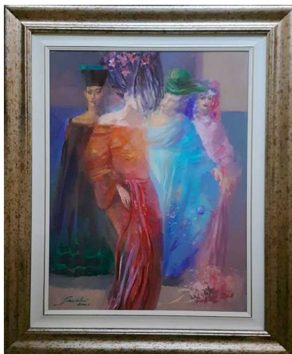
LOTTO 28 CARLO SCROCCHI (1938 – 2012) BASE D'ASTA 200,00 DIPINTO OLIO SU TELA RAFF. SFILATA DI MODA MIS. 70 X 50 FIRMATO E DATATO 2001 IN BASSO A SINISTRA