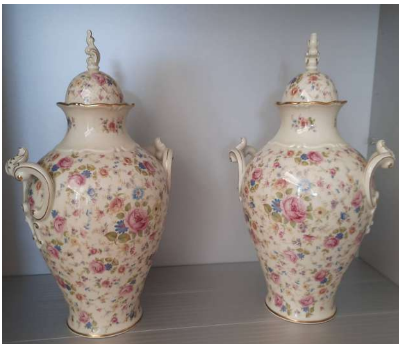
LOTTO 41 THOMAS IVORY BASE D'ASTA 250,00 LOTTO COMPOSTO DA 02 VASI IN CERAMICA DIPINTA A MOTIVI FLOREALI H. 50 BAVARIA GERMANIA PRIMA META' XX°SEC.