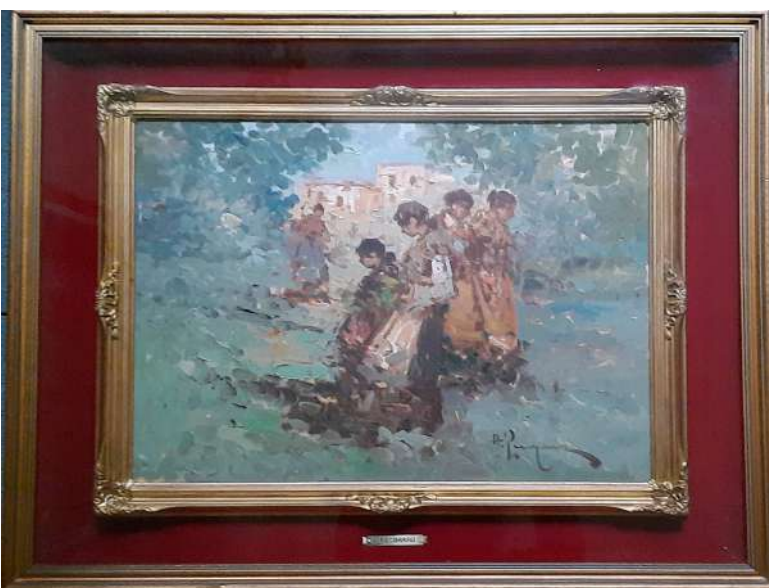
LOTTO 43 ANTONIO PECORARO (1938) BASE D'ASTA 200,00 DIPINTO OLIO SU TELA RAFF. RAGAZZE NEL BOSCO MIS. 40 X 50 FIRMATO IN BASSO A DESTRA