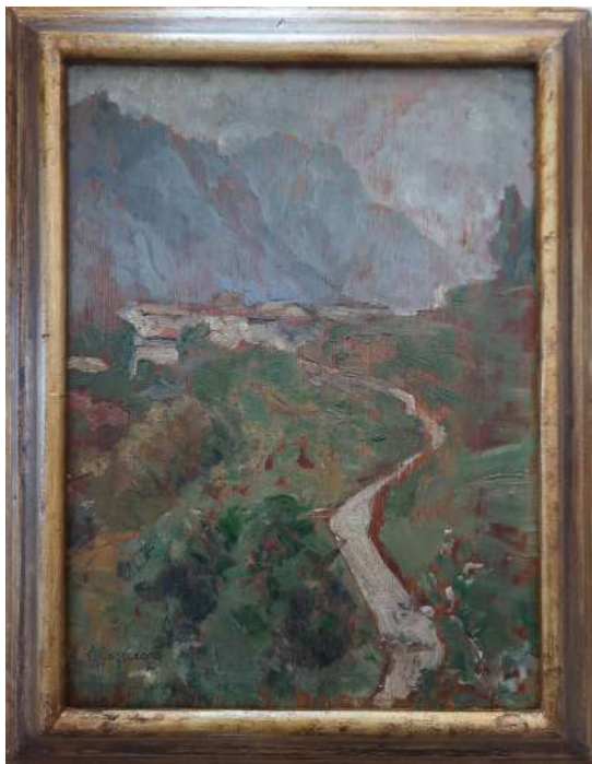
LOTTO 67 LEONARDO BAZZARO (1853 – 1937) BASE D'ASTA 200,00 DIPINTO OLIO SU TAVOLA RAFF. PAESAGGIO MONTANO MIS. 33 X 25 FIRMATO IN BASSO A SINISTRA