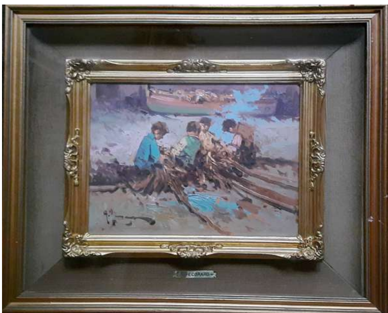
LOTTO 42 ANTONIO PECORARO (1938) BASE D'ASTA 150,00 DIPINTO OLIO SU TELA RAFF. PESCATORI MIS. 23 X 30 FIRMATO IN BASSO A SINISTRA