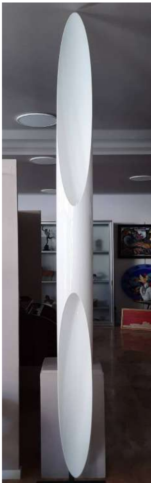
LOTTO 46 KUNDALINI BASE D'ASTA 1.250,00 LAMPADA DA PARETE MODELLO "SHAKTI FIX" H. 320 DIAM. 20