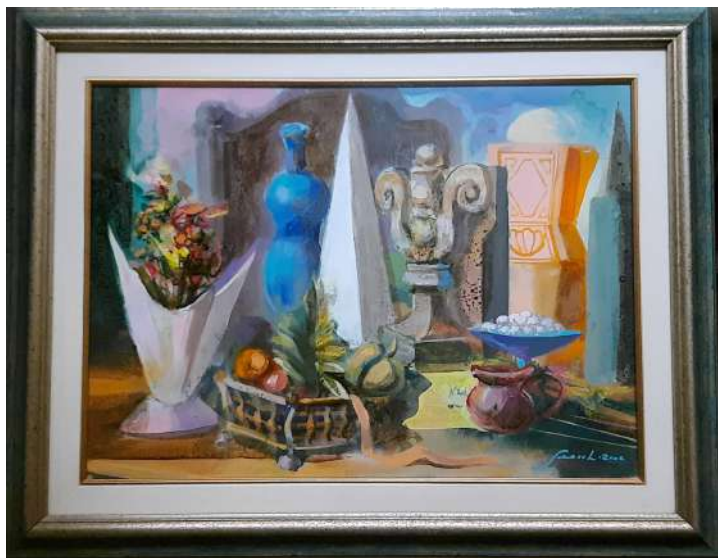
LOTTO 26 CARLO SCROCCHI (1938 – 2012) BASE D'ASTA 150,00 DIPINTO OLIO SU TELA RAFF. NATURA MORTA CON VASI MIS. 45 X 60 FIRMATO E DATATO 2002 IN BASSO A DESTRA