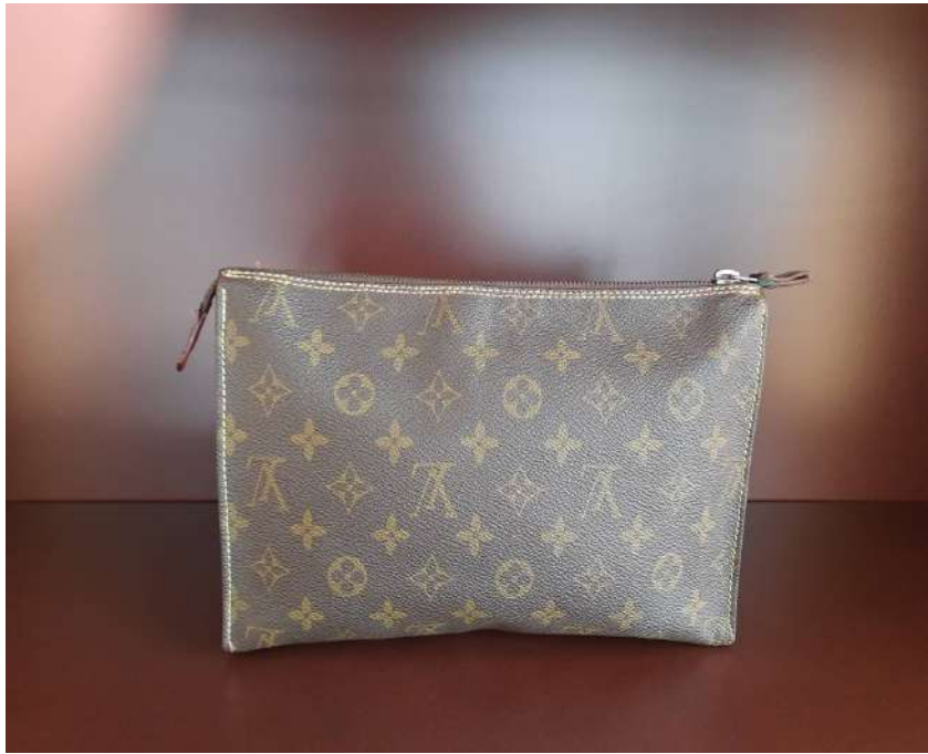
LOTTO 104 LOUIS VUITTON BASE D'ASTA 100,00 TROUSSE TOILETTE MONOGRAM VINTAGE PARIS ANNI 90