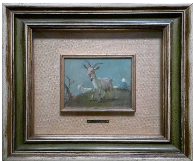
LOTTO 53 ALFREDO SORESSI (1897 – 1982) BASE D'ASTA 180,00 DIPINTO OLIO SU TAVOLA RAFF. CAPRETTE CON PASTORELLA MIS. 13 X 15 FIRMATO IN BASSO A DESTRA A RETRO AUTENTICA DELL'ARTISTA