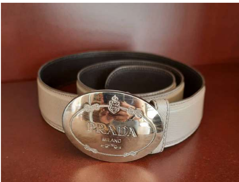
LOTTO 13 PRADA BASE D'ASTA 125,00 CINTURA DA DONNA IN PELLE COLOR TORTORA ITALIA ANNI 2015/2020