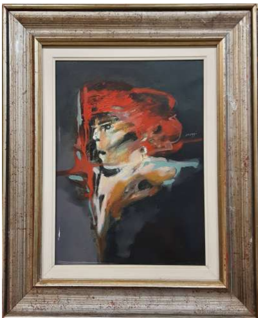
LOTTO 58 GUIDO MAGGI (1925) BASE D'ASTA 375,00 DIPINTO OLIO SU TELA INTITOLATO "GUERRIERO" MIS. 40 X 30 ANNO 1974 FIRMATO SUL LATO DESTRO