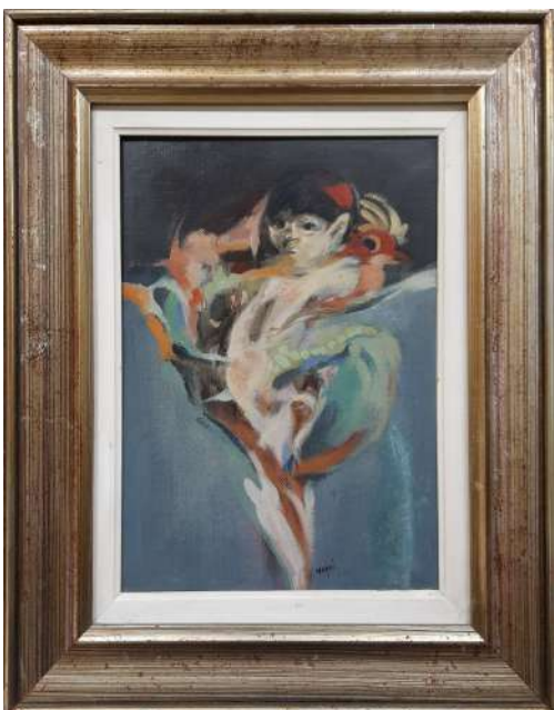
LOTTO 59 GUIDO MAGGI (1925) BASE D'ASTA 375,00 DIPINTO OLIO SU TELA INTITOLATO "BAMBINO CON PAVONI" MIS. 40 X 30 ANNO 1974 FIRMATO IN BASSO