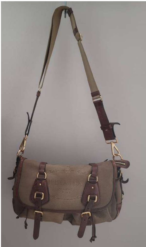
LOTTO 97 PRADA BASE D'ASTA 400,00 BORSA LOGO JACQUARD A CORDA + CAFFE' ITALIA ANNI 2015 CORREDATA DA CERTIFICATO DI GARANZIA