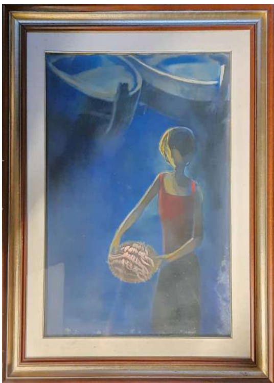
LOTTO 56 ELIANO FANTUZZI (1909 – 1987) BASE D'ASTA 200,00 DIPINTO OLIO SU TELA RAFF. RAGAZZA AL PORTO MIS. 70 X 50 FIRMATO IN BASSO A SINISTRA A RETRO TIMBRO "GALLERIA CONSORTI" ROMA