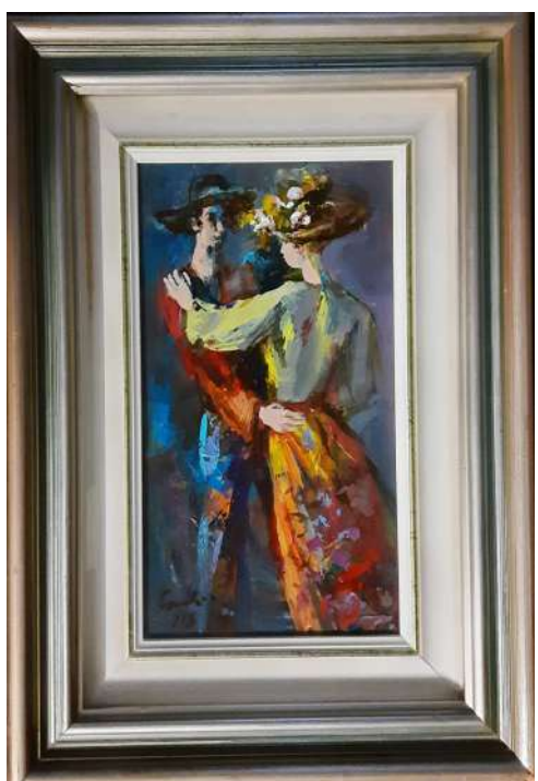
LOTTO 30 CARLO SCROCCHI (1938 – 2012) BASE D'ASTA 50,00 DIPINTO OLIO SU TAVOLA RAFF. BALLERINI MIS. 23 X 13 FIRMATO E DATATO 1975 IN BASSO A SINISTRA