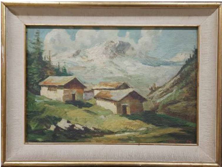
LOTTO 54 ERNESTO GIACOBBI (1891 – 1964) BASE D'ASTA 150,00 DIPINTO OLIO SU TAVOLA RAFF. PAESAGGIO MONTANO CON CASE MIS. 27 X 40 FIRMATO E DATATO 1953 IN BASSO A DESTRA