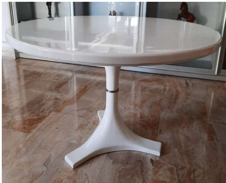
LOTTO 48 ANNA CASTELLI FERRIERI & IGNAZIO GARDELLA (XX°SEC.) BASE D'ASTA 800,00 TAVOLO PER KARTELL MODELLO "4993" IN POLIESTERE DIAM. 120 H. 72 ANNO 1967