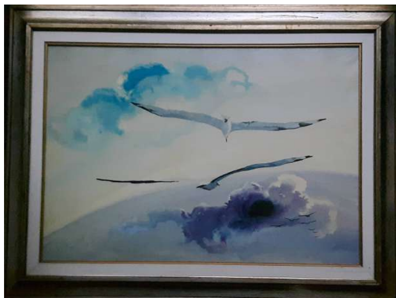
LOTTO 62 GUIDO MAGGI (1925) BASE D'ASTA 500,00 DIPINTO OLIO SU TELA INTITOLATO "VERSO LA LIBERTA" MIS. 50 X 70 FIRMATO A RETRO