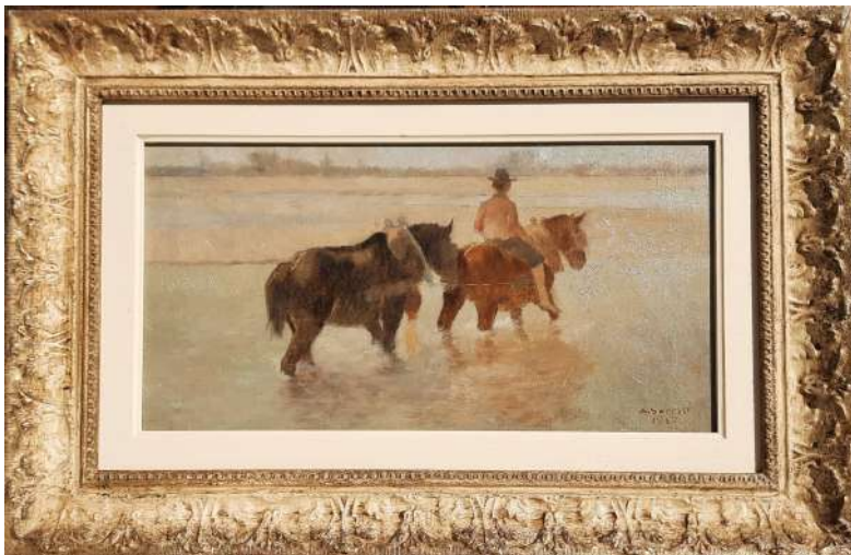
LOTTO 99 ALFREDO SORESSI (1897 – 1982) BASE D'ASTA 660,00 DIPINTO OLIO SU TAVOLA RAFF. CAVALLI CHE ATTRAVERSANO IL FIUME MIS. 23 X 43 FIRMATO E DATATO 1967 IN BASSO A DESTRA