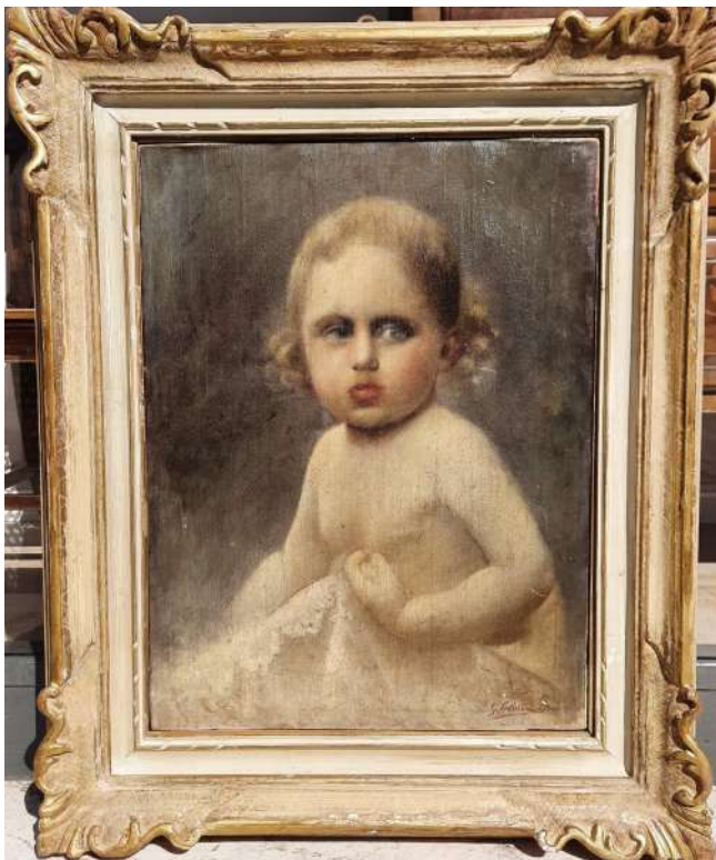
LOTTO 102 FIRMA ILLEGGIBILE (XIX°SEC.) BASE D'ASTA 800,00 DIPINTO OLIO SU TELA RAFF. RITRATTO DI BAMBINO MIS. 48 X 38 FIRMATO IN BASSO A DESTRA