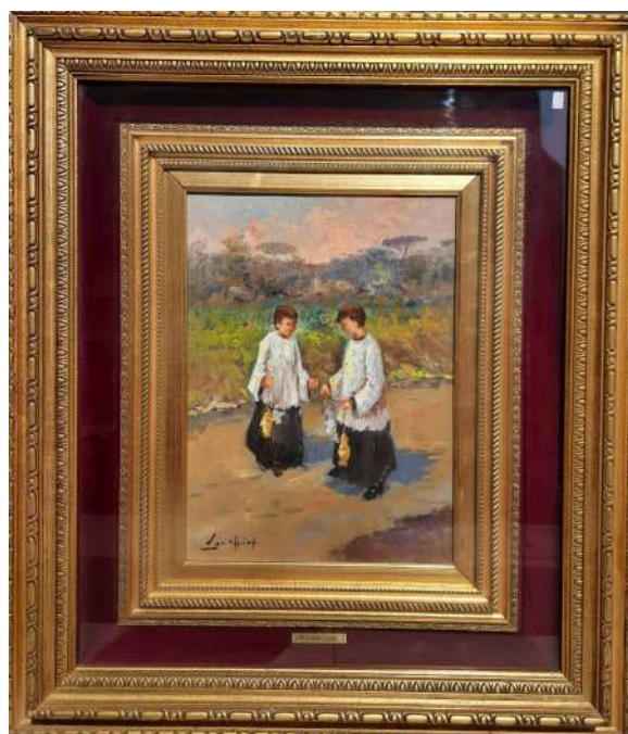
LOTTO 73 VINCENZO LARICCHIA (1940) BASE D'ASTA 250,00 DIPINTO OLIO SU TELA RAFF. CHERICHETTI MIS. 40 X 30 FIRMATO IN BASSO A SINISTRA