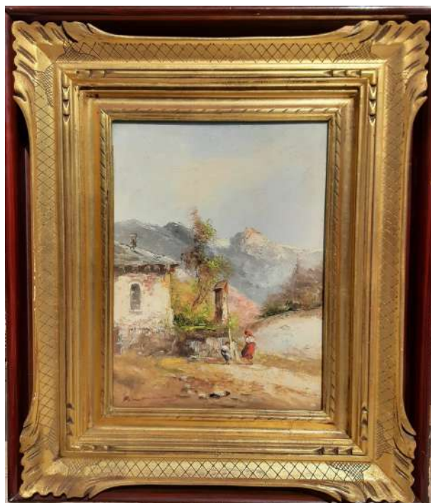
LOTTO 90 FRANCESCO PAOLO MANCINI (1900 - ?) BASE D'ASTA 125,00 DIPINTO OLIO SU TELA APPLICATA SU TAVOLA RAFF. PAESAGGIO MONTANO CON FIGURE MIS. 35 X 25 FIRMATO IN BASSO A SINISTRA