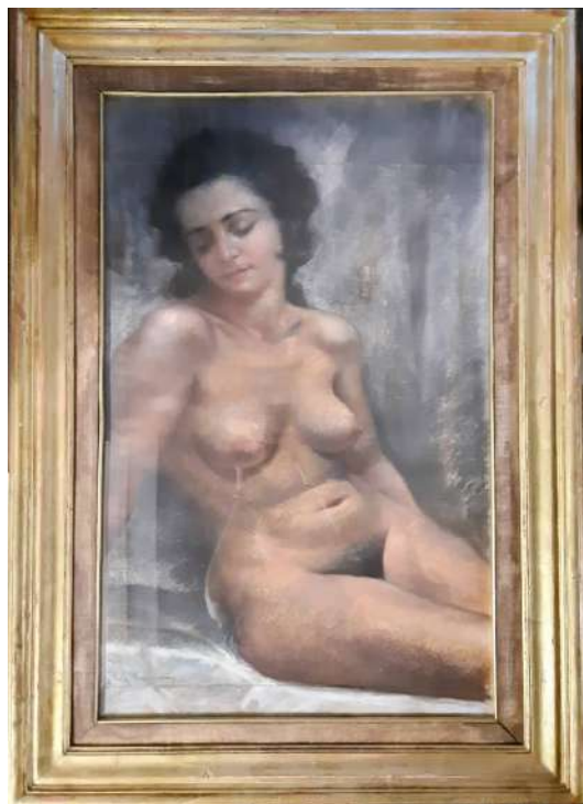
LOTTO 23 GIAN RITO BACCARINI (1895 – 1970) BASE D'ASTA 700,00 DIPINTO TECNICA MISTA SU CARTONE RAFF. NUDO FEMMINILE MIS. 80 X 50 FIRMATO IN BASSO A SINISTRA