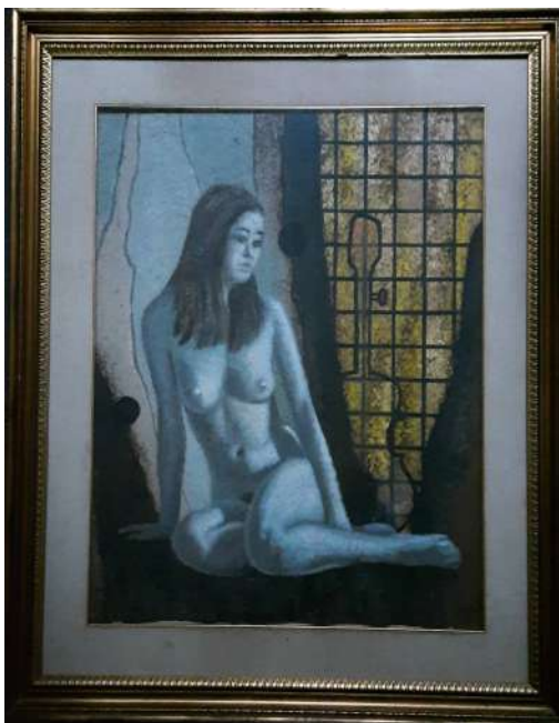
LOTTO 57 GIANFRANCO RONTANI (1926 – 2018) BASE D'ASTA 150,00 DIPINTO OLIO SU TELA INTITOLATO "NUDO" MIS. 70 X 60 FIRMATO E DATATO 1974 IN BASSO A DESTRA