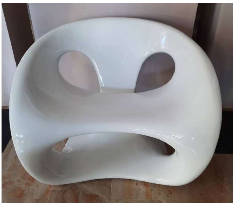
LOTTO 49 GIORGIO GURIOLI (XX°SEC.) BASE D'ASTA 2.000,00 POLTRONA PER KUNDALINI MODELLO "HARA" IN VETRORESINA LACCATA COLOR BIANCO H. 70 - LUNGH. 86 - PROF. 70 ANNO 2002