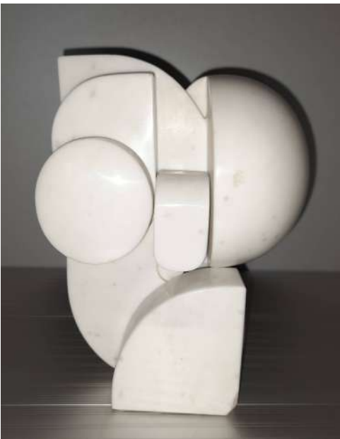
LOTTO 92 ANDREA CASCELLA (1920 – 1990) BASE D'ASTA 1.500,00 SCULTURA IN MARMO INTITOLATA "ORIGINE" MIS. 21 X 18 X 13 ANNO 1987 SIGLATA 3 / 10