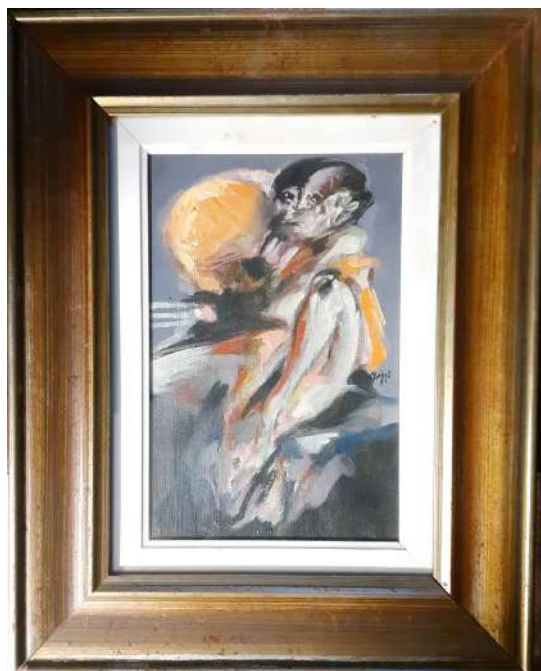
LOTTO 60 GUIDO MAGGI (1925) BASE D'ASTA 250,00 DIPINTO OLIO SU TELA INTITOLATO "RAGAZZO CON SOLE" MIS. 30 X 20 ANNO 1974 FIRMATO SUL LATO DESTRO