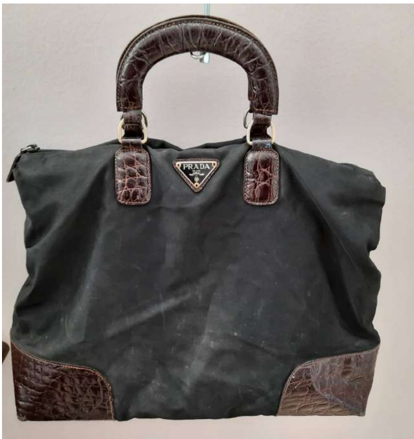
LOTTO 83 PRADA BASE D'ASTA 150,00 BORSA IN TESSUTO TECNICO NERO CON INSERTI IN PELLE STAMPATA ITALIA ANNI 2000