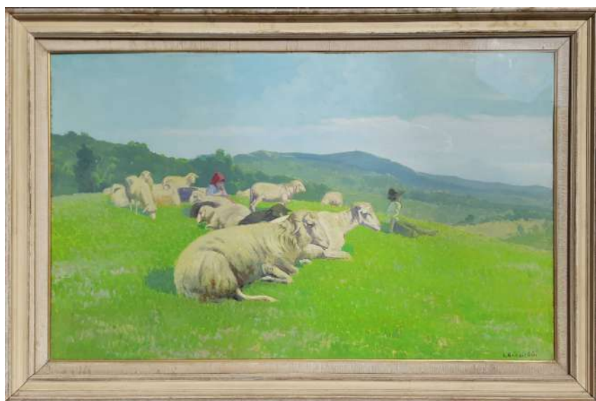
LOTTO 84 ERNESTO GIACOBBI (1891 – 1964) BASE D'ASTA 680,00 DIPINTO OLIO SU TAVOLA RAFF. GREGGE CON PASTORELLI MIS. 75 X 130 FIRMATO IN BASSO A DESTRA