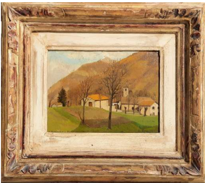
LOTTO 101 ARNALDO RONCHI (1898 – 1985) BASE D'ASTA 160,00 DIPINTO OLIO SU CARTONE INTITOLATO "S. PANCRAZIO - RAMPONIO" MIS. 19 X 27,5 ANNO 1943 FIRMATO IN BASSO A DESTRA