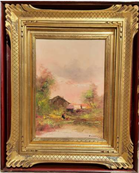
LOTTO 91 FRANCESCO PAOLO MANCINI (1900 - ?) BASE D'ASTA 125,00 DIPINTO OLIO SU TELA APPLICATA SU TAVOLA RAFF. PAESAGGIO LACUSTRE CON FIGURE MIS. 35 X 25 FIRMATO IN BASSO A DESTRA