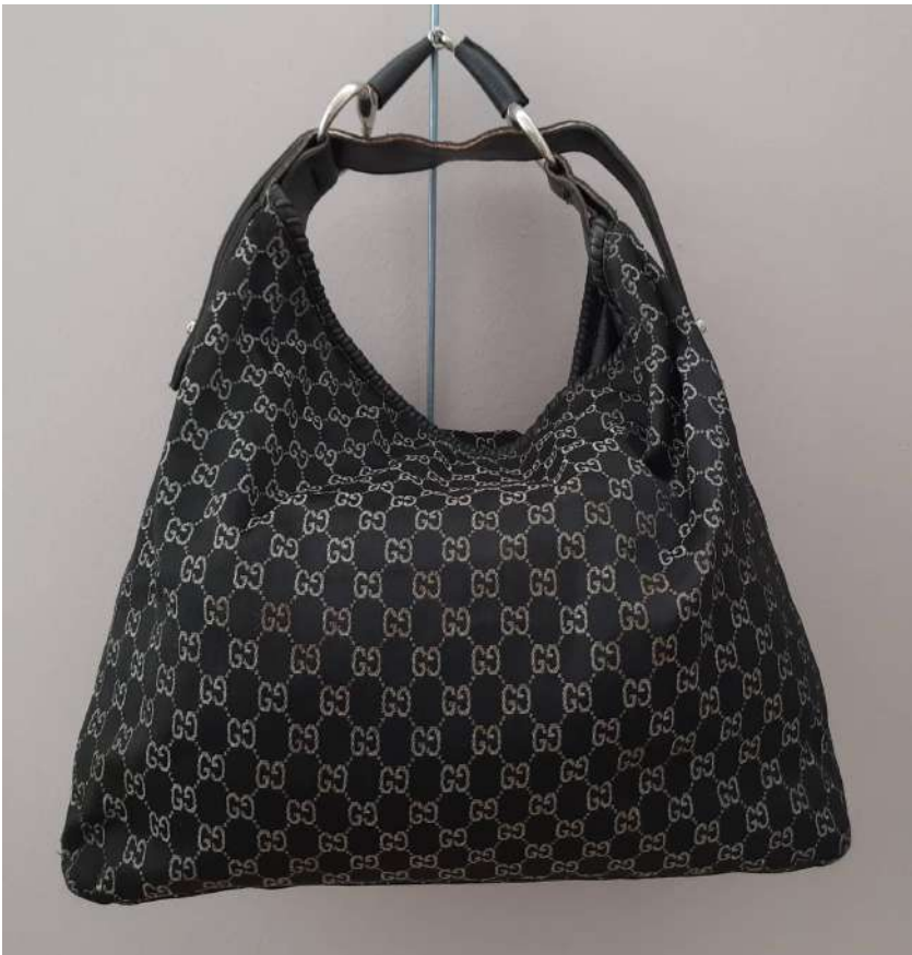
LOTTO 82 GUCCI BASE D'ASTA 250,00 BORSA IN TESSUTO MONOGRAMMATO NERO CON INSERTI IN PELLE ITALIA ANNI 2010