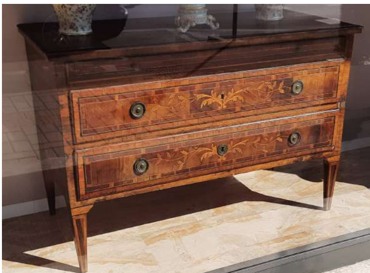
LOTTO 37 BASE D'ASTA 700,00 COMO' A 2 CASSETTI E MEZZO IN LEGNO DI NOCE LASTRONATO CON INTARSI A RAMAGE FLOREALI IN VARIE ESSENZE LIGNEE MIS. 136 X 62 H. 88,5 EPOCA LUIGI XVI° LOMBARDIA FINE XVIII°SEC.