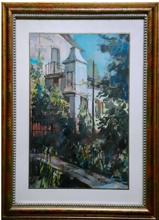
LOTTO 36 CARLO SCROCCHI (1938 – 2012) BASE D'ASTA 80,00 DIPINTO OLIO SU CARTONE RAFF. VILLA MIS. 45 X 31 FIRMATO E DATATO 2000 IN BASSO A DESTRA