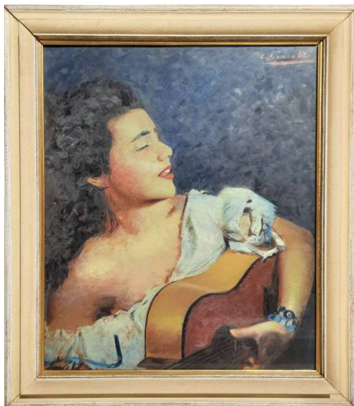
LOTTO 86 ERNESTO GIACOBBI (1891 – 1964) BASE D'ASTA 1.000,00 DIPINTO OLIO SU TAVOLA RAFF. GITANA CON CHITARRA MIS. 66 X 54 FIRMATO IN ALTO A DESTRA