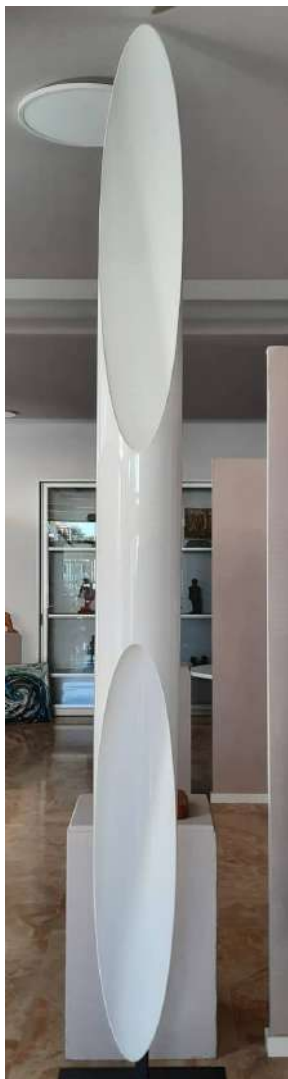
LOTTO 45 KUNDALINI BASE D'ASTA 1.250,00 LAMPADA DA PARETE MODELLO "SHAKTI FIX" H. 320 DIAM. 20