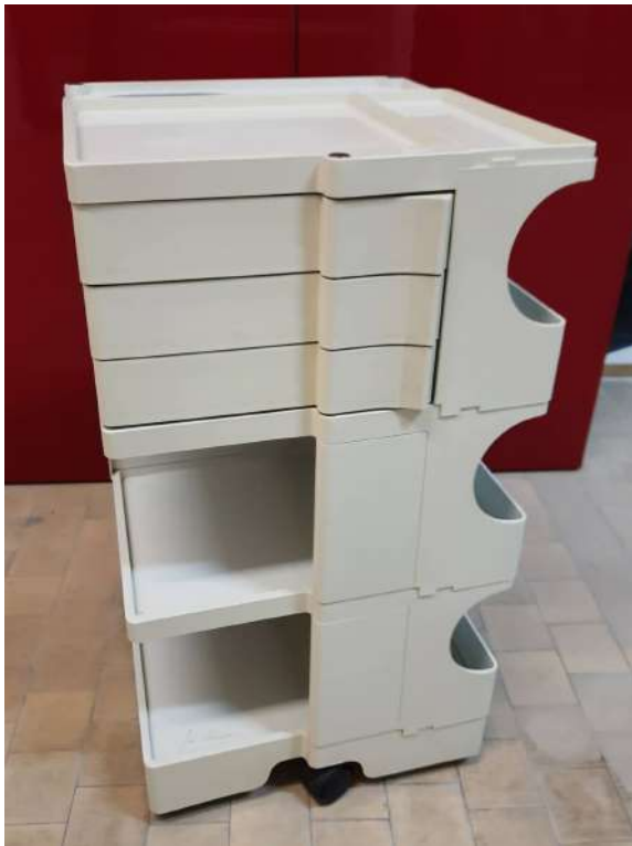
LOTTO 44 JOE COLOMBO (1930 – 1971) BASE D'ASTA 400,00 BOBY ROLLING CART IN PLASTICA MIS. 41 X 43 H. 74 FIRMATO SULLA BASE