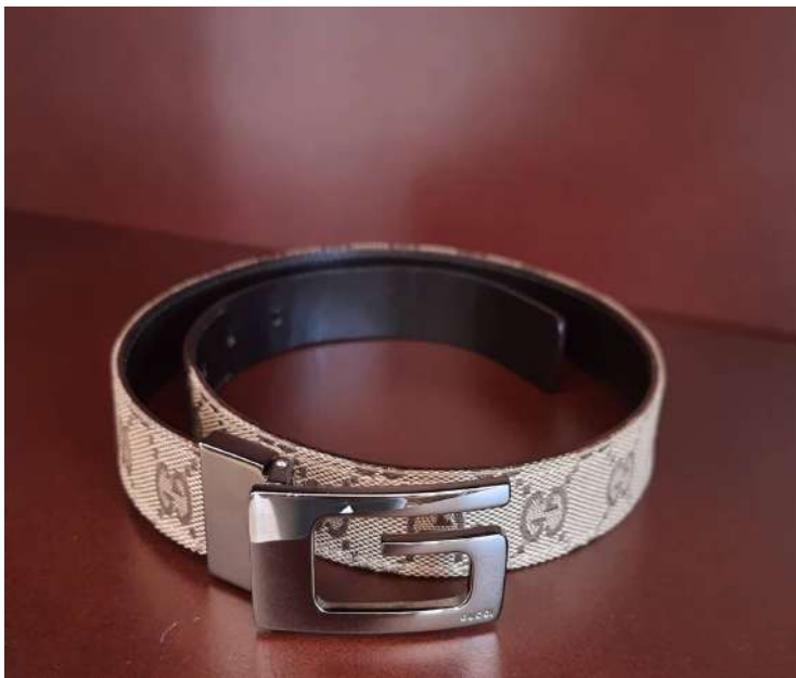
LOTTO 14 GUCCI BASE D'ASTA 125,00 CINTURA DA DONNA IN PELLE E TESSUTO MONOGRAMMATO "GG" ITALIA ANNI 2015/2020