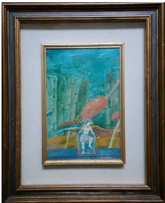
LOTTO 51 ROMANO TAGLIAFERRI (1940 – 2006) BASE D'ASTA 200,00 DIPINTO OLIO SU TAVOLA RAFF. FONDALE MARINO CON FIGURA MIS. 30 X 20 FIRMATO IN BASSO A DESTRA