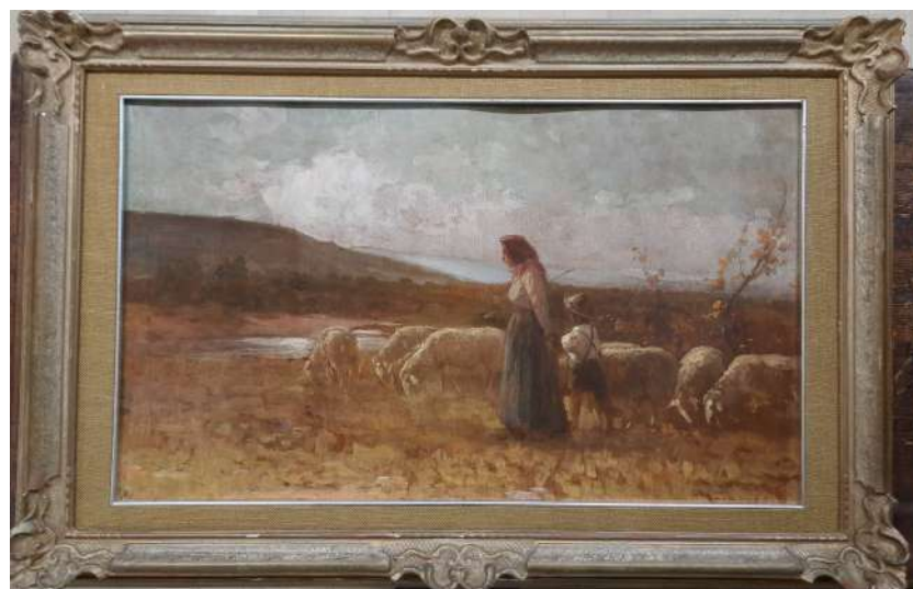
LOTTO 24 ERNESTO GIACOBBI (1891 – 1964) BASE D'ASTA 800,00 DIPINTO OLIO SU TAVOLA RAFF. PAESAGGIO CON PASTORELLI E GREGGE MIS. 46 X 74 FIRMATO IN BASSO A DESTRA