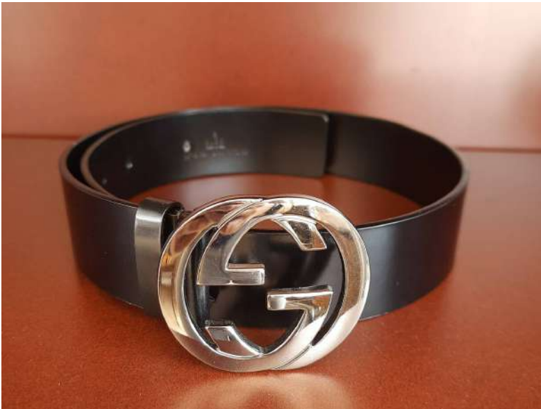
LOTTO 12 GUCCI BASE D'ASTA 125,00 CINTURA DA DONNA IN PELLE NERA CON FIBBIA "GG" ITALIA ANNI 2015/2020