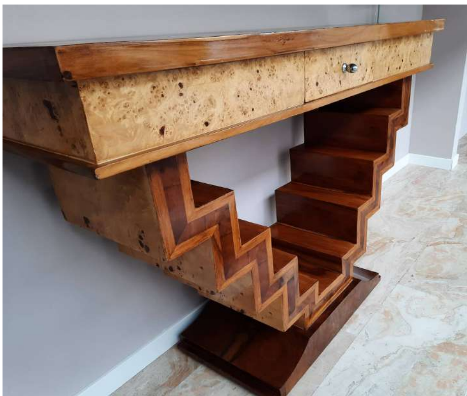
LOTTO 94 BASE D'ASTA 800,00 CONSOLLE IN STILE DECO' IN RADICA DI THUYA MIS. 120 X 40 H. 85 EPOCA XX°SEC.