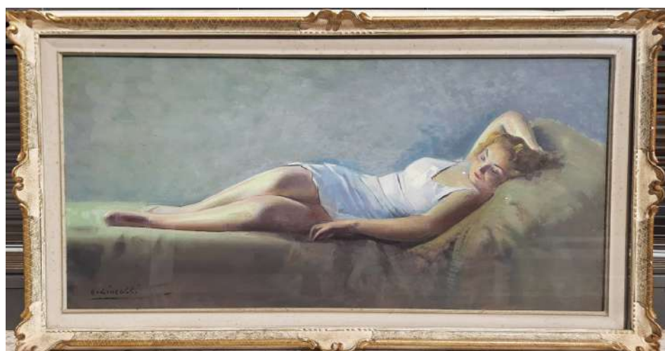
LOTTO 85 ERNESTO GIACOBBI (1891 – 1964) BASE D'ASTA 1.000,00 DIPINTO OLIO SU TAVOLA RAFF. DONNA DISTESA MIS. 50 X 100 FIRMATO IN BASSO A SINISTRA