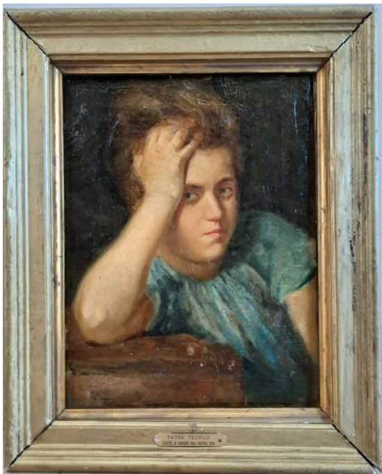
LOTTO 66 TEOFILO PATINI (1840 – 1906) BASE D'ASTA 700,00 DIPINTO OLIO SU TELA RAFF. RITRATTO MIS. 29 X 23 FIRMATO IN BASSO A SINISTRA