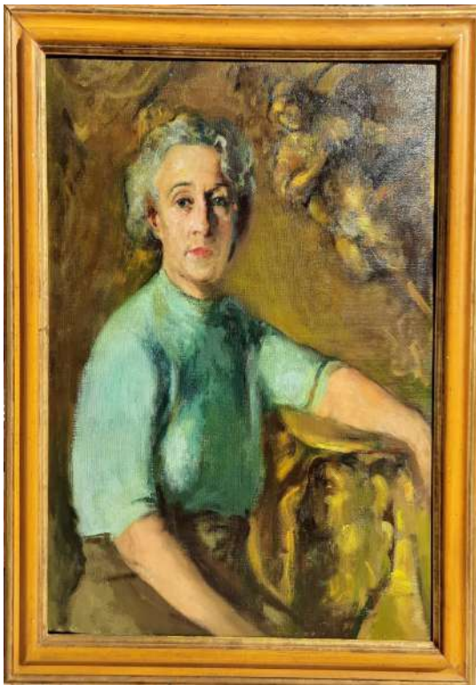
LOTTO 98 ERCOLE CASALI (1884 – 1948) BASE D'ASTA 470,00 DIPINTO OLIO SU TELA RAFF. RITRATTO DI SIGNORA MIS. 75 X 60 PUBBLICATO A PAG. 26 DEL LIBRO "ERCOLE CASALI" ASSOCIAZIONE AMICI DELL'ARTE