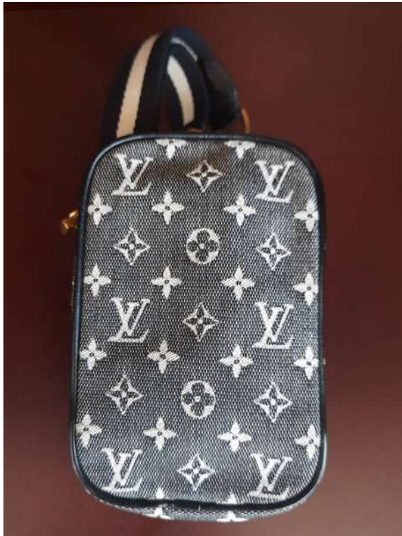
LOTTO 09 LOUIS VUITTON BASE D'ASTA 200,00 BORSELLO PORTAFOTOCAMERA CON TRACOLLA IN TESSUTO MONOGRAMMATO PARIS ANNI 2015/2020