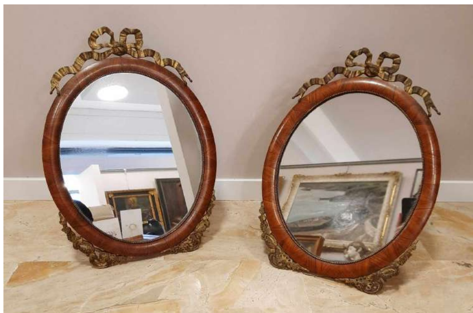
LOTTO 29 EPOCA NAPOLEONE III° BASE D'ASTA 150,00 LOTTO COMPOSTO DA 02 SPECCHIERINE OVALI IN BOIS DE ROSE MIS. 52 X 36 FINE XIX° SEC.