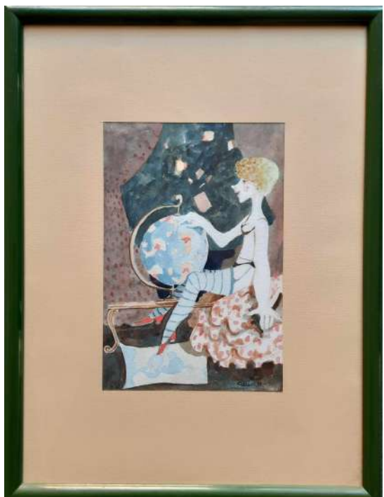
LOTTO 18 ALBERTO GALLERATI (1945) BASE D'ASTA 150,00 DIPINTO TECNICA MISTA SU CARTA RAFF. DONNA CON MAPPAMONDO MIS. 21 X 14 FIRMATO E DATATO 1983 IN BASSO A DESTRA