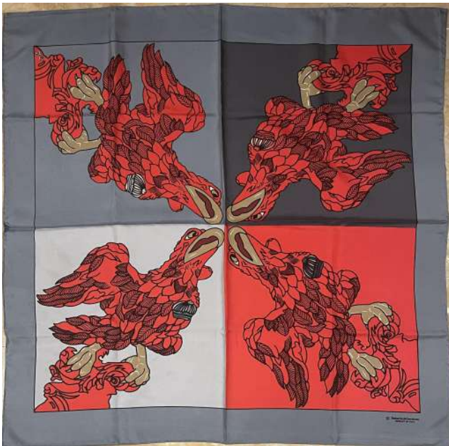
LOTTO 44 ROBERTA DI CAMERINO BASE D'ASTA 100,00 FOULARD IN SETA