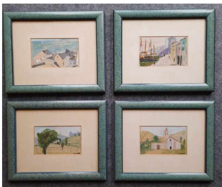
LOTTO 32 LUCIANO RICCHETTI (1897 – 1977) BASE D'ASTA 400,00 LOTTO COMPOSTO DA 04 DIPINTI OLIO SU CARTONE RAFF. PAESAGGI MIS. 10 X 16 FIRMATI IN BASSO A DESTRA