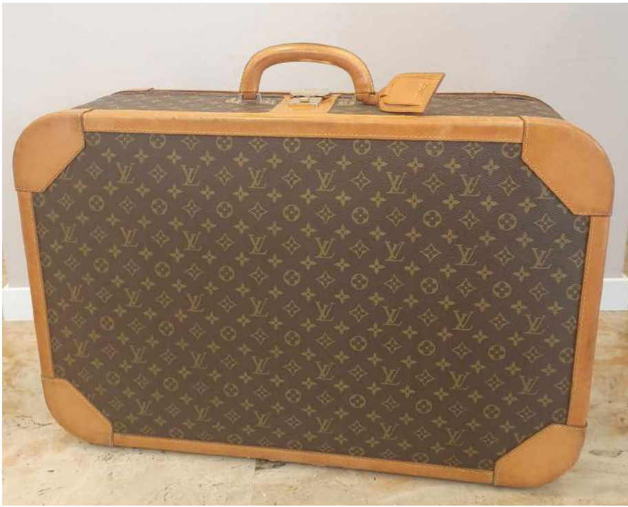
LOTTO 07 LOUIS VUITTON BASE D'ASTA 500,00 VALIGIA MODELLO "STRATOS" MONOGRAM CON BORDI IN PELLE PARIGI ANNI 80