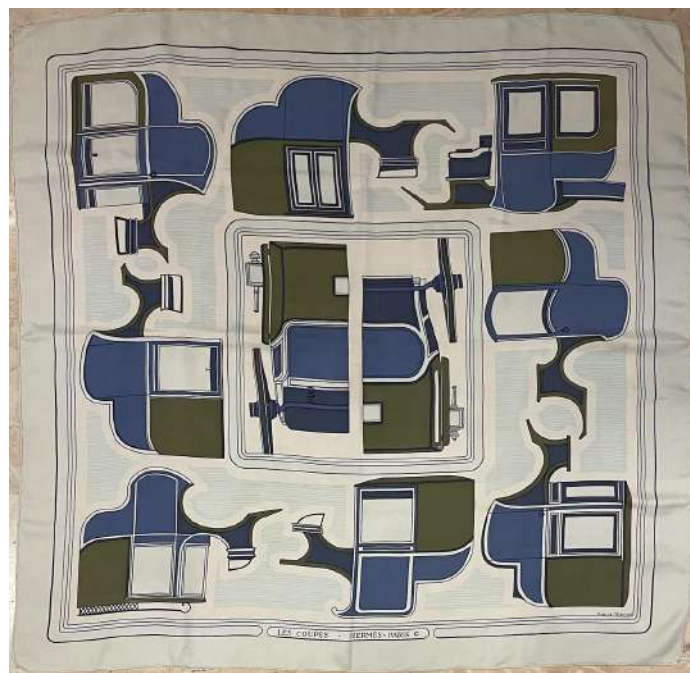
LOTTO 48 HERMES BASE D'ASTA 280,00 FOULARD IN SETA