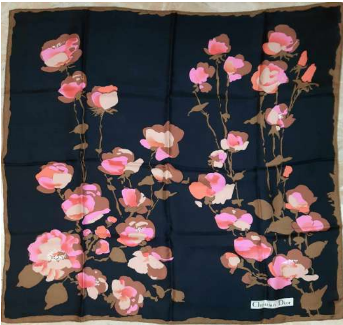
LOTTO 40 CHRISTIAN DIOR BASE D'ASTA 100,00 FOULARD IN SETA