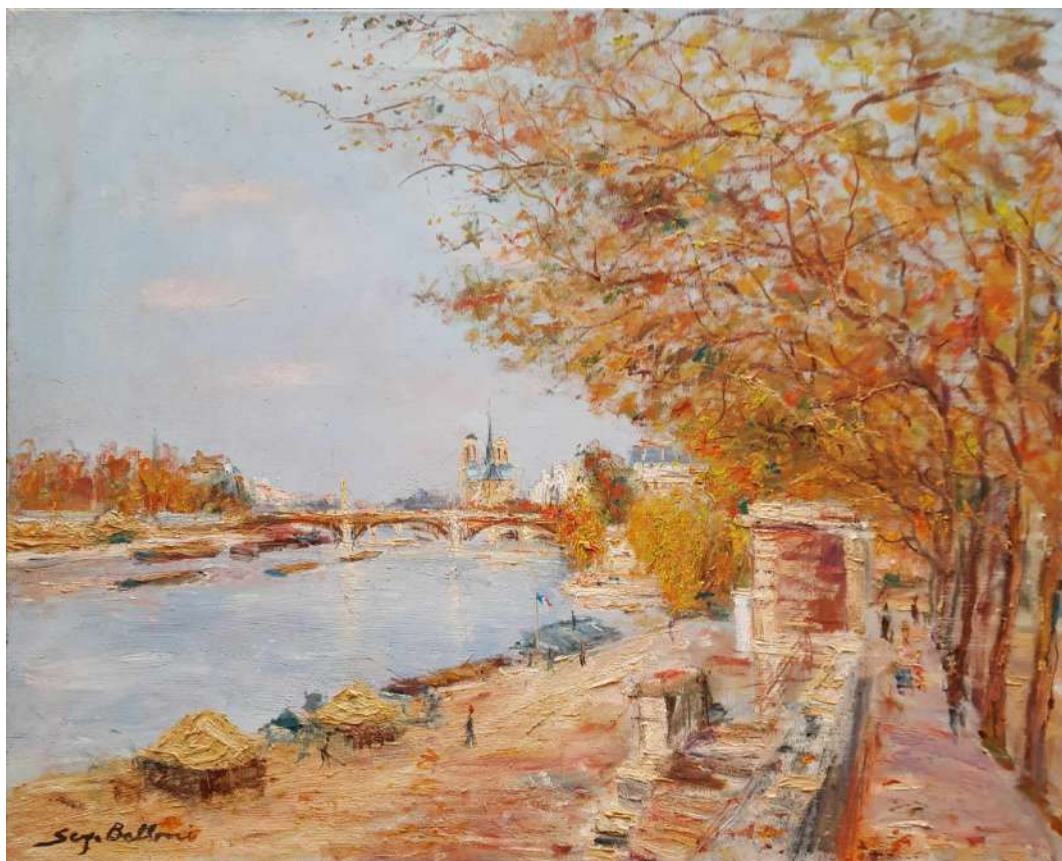
LOTTO 60 SERGE BELLONI (1925 – 2005) BASE D'ASTA 400,00 DIPINTO OLIO SU TELA RAFF. VEDUTA AUTUNNALE DI NOTRE DAME A PARIGI MIS. 54 X 65 FIRMATO IN BASSO A SINISTRA