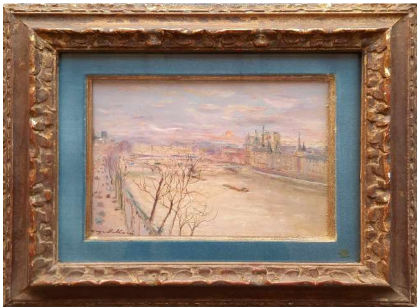
LOTTO 57 SERGE BELLONI (1925 – 2005) BASE D'ASTA 200,00 DIPINTO OLIO SU CARTONE RAFF. VEDUTA DELLA SENNA AL TRAMONTO MIS. 22 X 27 FIRMATO IN BASSO A SINISTRA