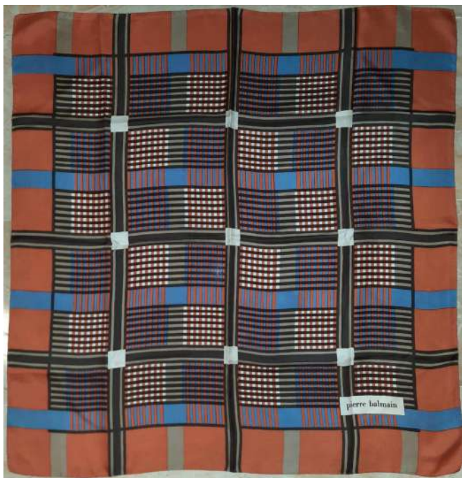
LOTTO 41 PIERRE BALMAIN BASE D'ASTA 100,00 FOULARD IN SETA