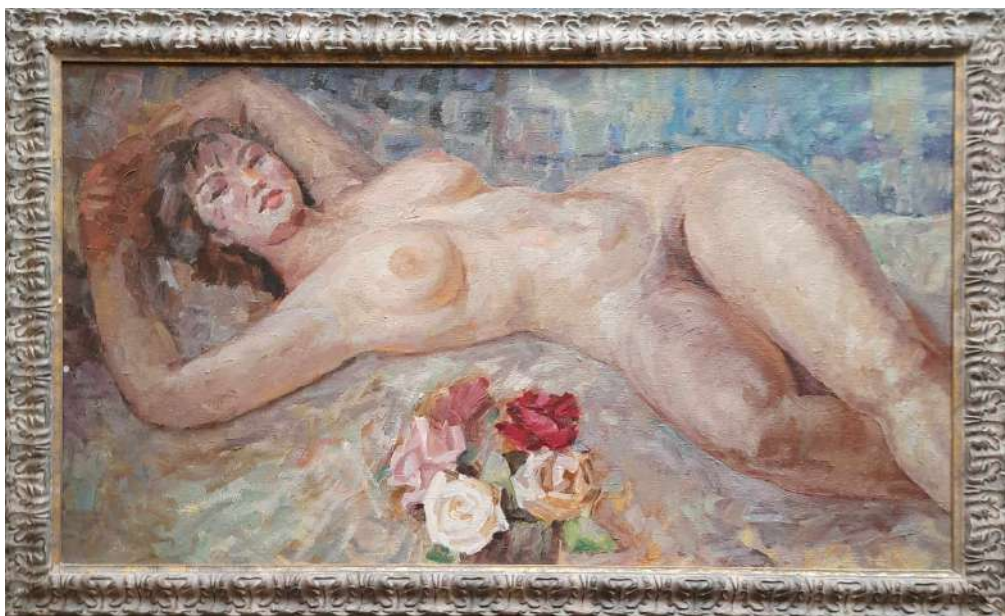
LOTTO 30 MAESTRO ANONIMO (INIZI XX°SEC.) BASE D'ASTA 250,00 DIPINTO OLIO SU TELA RAFF. NUDO FEMMINILE CON ROSE MIS. 50 X 80