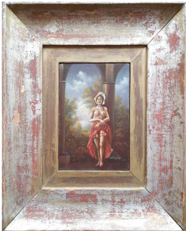
LOTTO 21 C. BROGLIORA (INIZI XX°SEC.) BASE D'ASTA 150,00 DIPINTO OLIO SU TAVOLA RAFF. NUDO FEMMINILE MIS. 13,5 X 9,5 FIRMATO IN BASSO A DESTRA