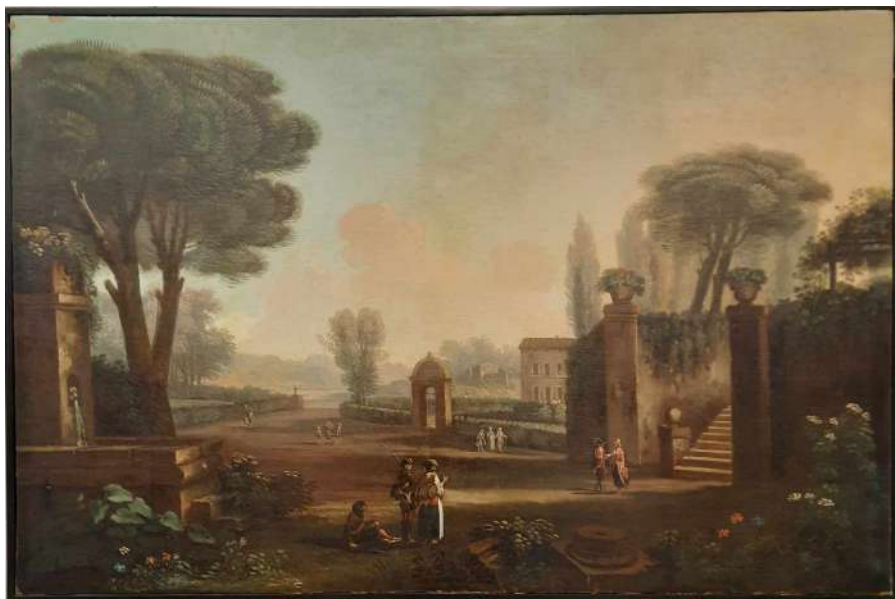
LOTTO 26 MAESTRO VENETO (INIZI XVIII°SEC.) BASE D'ASTA 600,00 DIPINTO OLIO SU TELA RAFF. PAESAGGIO CON FIGURE MIS. 92 X 138