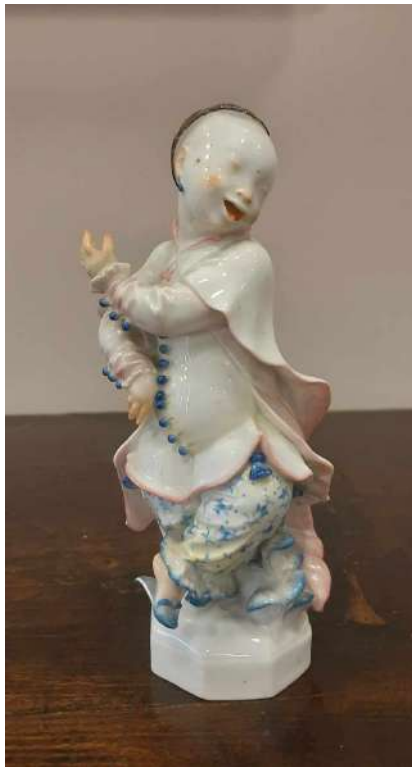
LOTTO 34 MEISSEN (FINE XIX°SEC.) BASE D'ASTA 130,00 SCULTURA IN CERAMICA RAFF. FIGURA FEMMINILE ORIENTALE H. 18