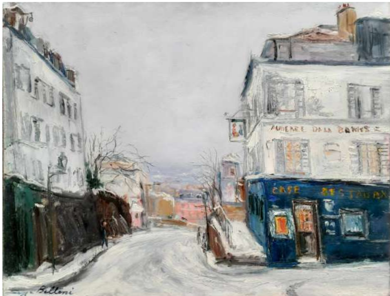
LOTTO 55 SERGE BELLONI (1925 – 2005) BASE D'ASTA 300,00 DIPINTO OLIO SU TELA RAFF. AUBERGE DE LA BONNE FRANQUETTE A MONTMATRE A PARIGI MIS. 46 X 55 FIRMATO IN BASSO A SINISTRA