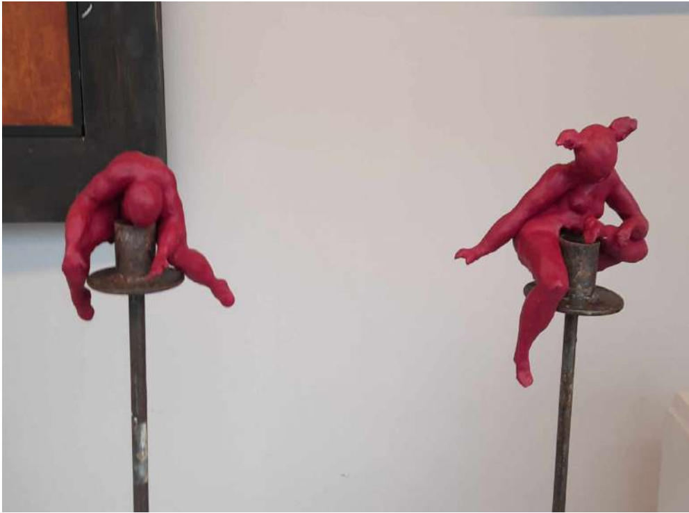
LOTTO 38 PAOLA FOPPIANI (1966) BASE D'ASTA 1.120,00 LOTTO COMPOSTO DA 02 SCULTURE IN TERRACOTTA RAFF. DIAVOLO E DIAVOLETTA H. 10 E H. 14