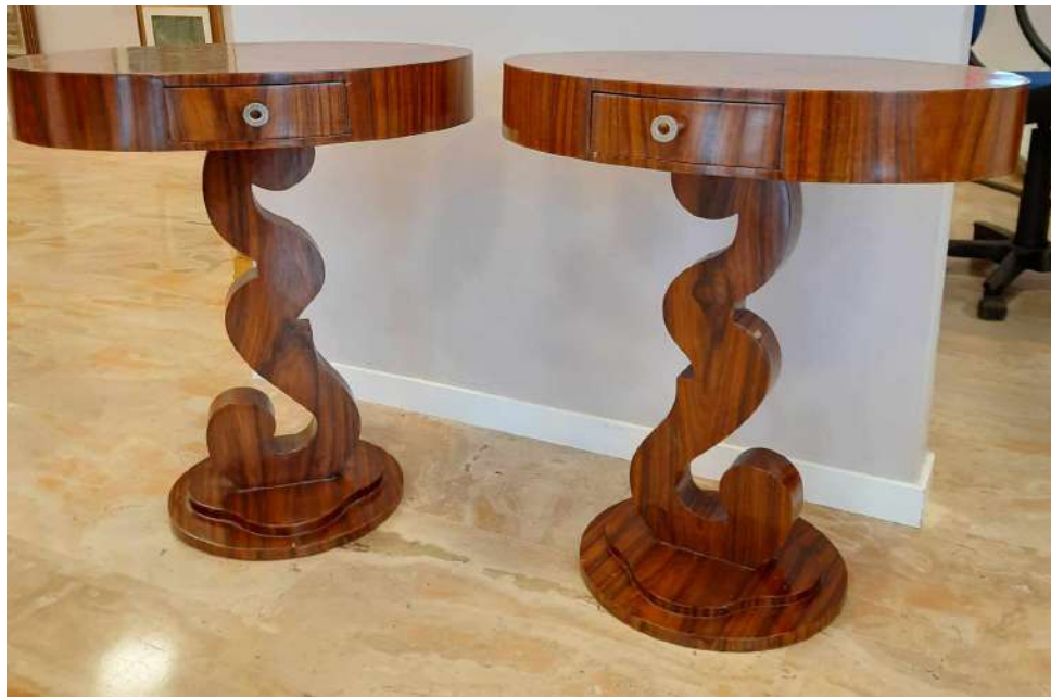
LOTTO 28 STILE ART DECO' (INIZI XX°SEC.) BASE D'ASTA 500,00 LOTTO COMPOSTO DA 02 TAVOLINI PENDANT IN LEGNO DI PALISSANDRO H. 71 MIS. 40 X 60