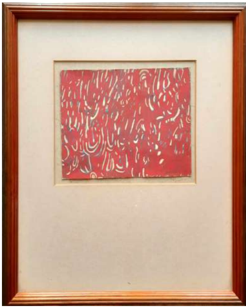
LOTTO 13 MAURO FORNARI (1949) BASE D'ASTA 100,00 DIPINTO OLIO SU CARTA RAFF. ASTRATTO MIS. 16 X 21