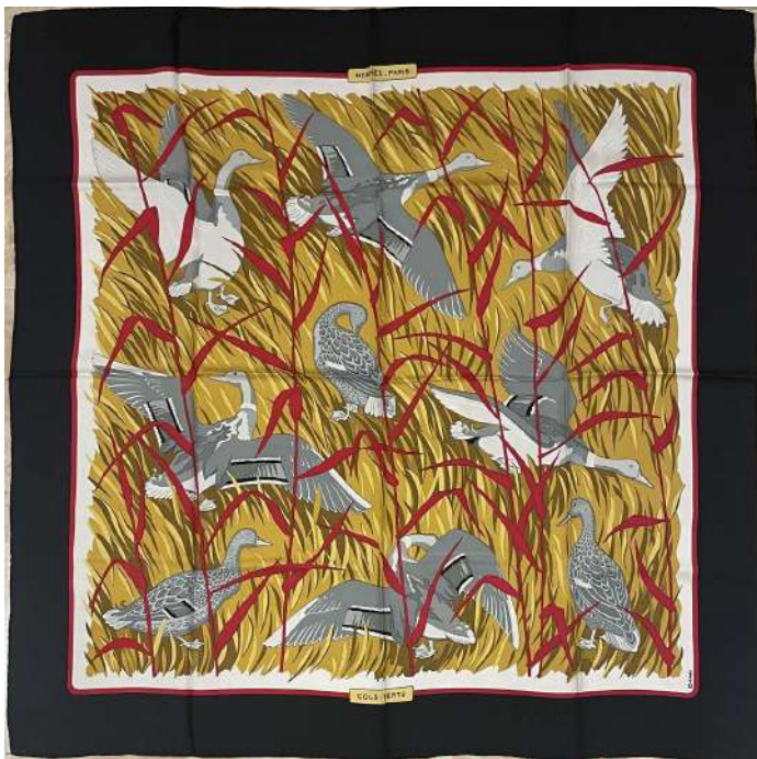
LOTTO 46 HERMES BASE D'ASTA 280,00 FOULARD IN SETA