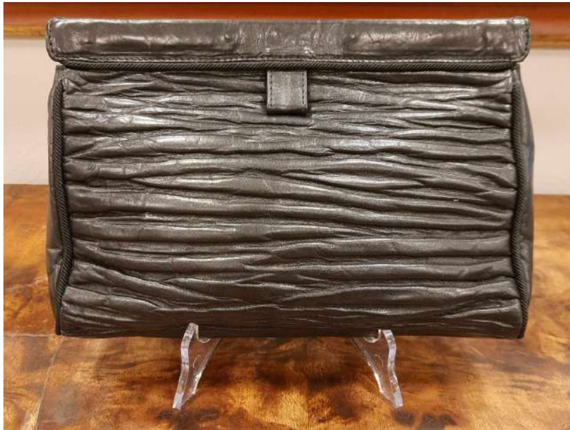
LOTTO 53 PRADA BASE D'ASTA 190,00 POCHETTE IN PELLE NERA