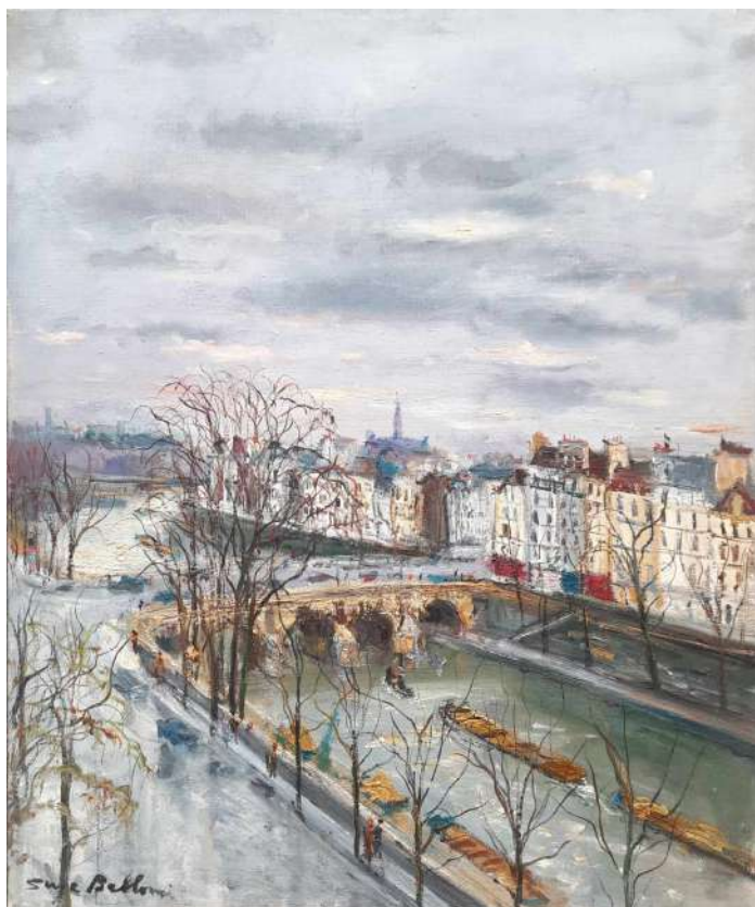
LOTTO 56 SERGE BELLONI (1925 – 2005) BASE D'ASTA 300,00 DIPINTO OLIO SU TELA INTITOLATO "VUE DE LA CITE' DES ARTS" MIS. 55 X 46 FIRMATO IN BASSO A SINISTRA