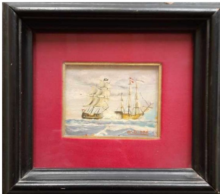
LOTTO 31 W. BLOOD (INIZI XX°SEC.) BASE D'ASTA 100,00 DIPINTO OLIO SU CARTONE RAFF. VELIERI MIS. 8 X 11 FIRMATO IN BASSO A DESTRA