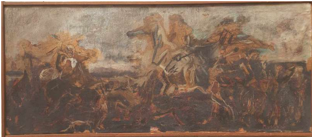
LOTTO 11 LUDOVICO MOSCONI (1928 – 1987) BASE D'ASTA 200,00 DIPINTO TECNICA MISTA SU CARTA APPLICATA SU TELA RAFF. BATTAGLIA MIS. 22 X 56 FIRMATO IN BASSO A DESTRA