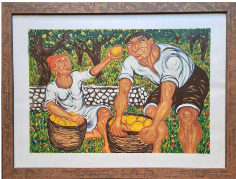
LOTTO 05 GIUSEPPE MIGNECO (1908 – 1997) BASE D'ASTA 150,00 LITOGRAFIA INTITOLATA "LA RACCOLTA DEI LIMONI" MIS. 70 X 100 SIGLATA 56 / 120 FIRMATA IN BASSO A DESTRA