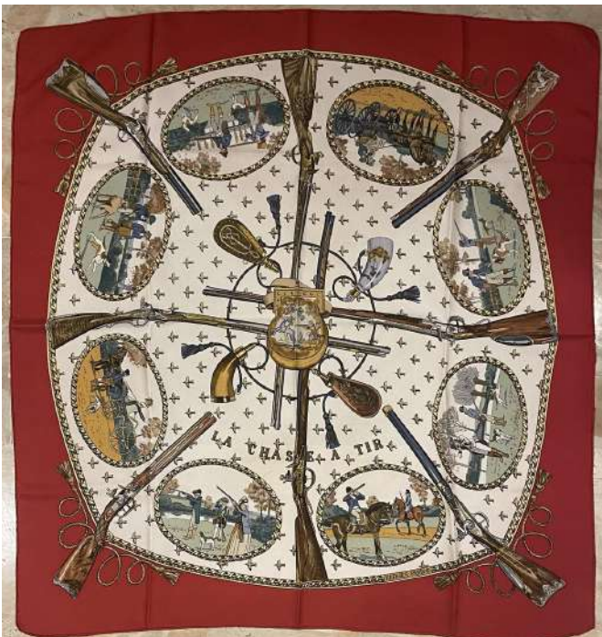
LOTTO 45 HERMES BASE D'ASTA 350,00 FOULARD IN SETA