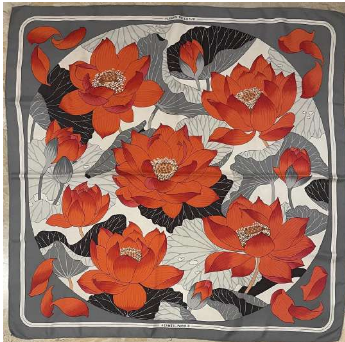
LOTTO 47 HERMES BASE D'ASTA 280,00 FOULARD IN SETA