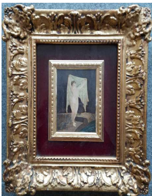
LOTTO 33 MAESTRO ANONIMO (INIZI XX°SEC.) BASE D'ASTA 200,00 DIPINTO OLIO SU TAVOLA RAFF. NUDO FEMMINILE CON SCIALLE MIS. 14 X 10