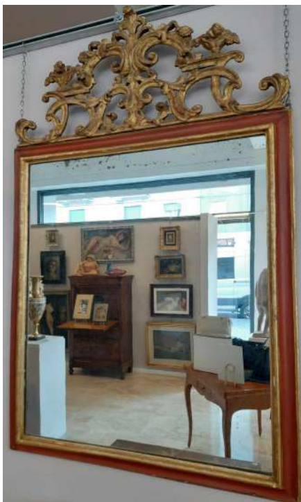
LOTTO 16 EPOCA LUIGI XVI° BASE D'ASTA 350,00 SPECCHIERA IN LEGNO DORATO MIS. 150 X 93 PIEMONTE EPOCA LUIGI XVI°