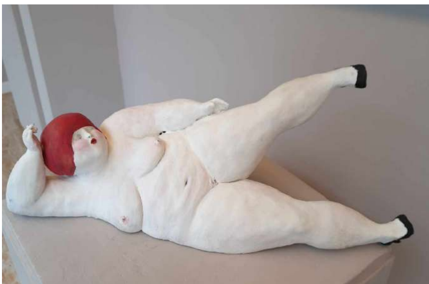
LOTTO 36 PAOLA FOPPIANI (1966) BASE D'ASTA 840,00 SCULTURA IN TERRACOTTA RAFF. NUDO FEMMINILE DISTESO H. 20 MIS. 53 X 21