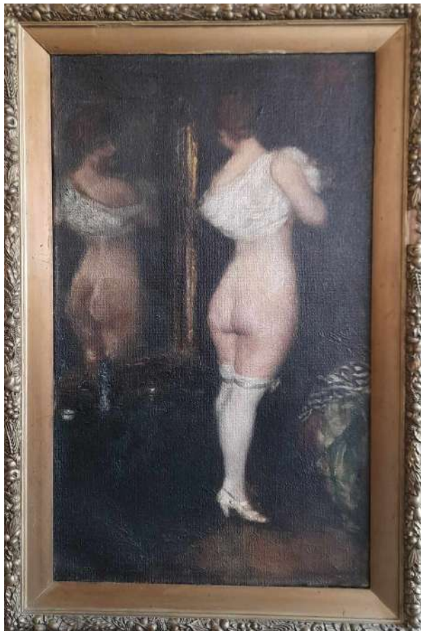
LOTTO 25 MIKLOS MIHALOVITS (1888 – 1960) BASE D'ASTA 300,00 DIPINTO OLIO SU TELA RAFF. NUDO DI DONNA ALLO SPECCHIO MIS. 90 X 51 FIRMATO E DATATO 1915 IN BASSO A DESTRA