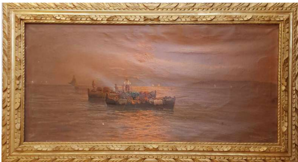
LOTTO 27 REMO TESTA (XX°SEC.) BASE D'ASTA 300,00 DIPINTO OLIO SU TELA RAFF. MARINA CON PESCATORI MIS. 60 X 120 FIRMATO IN BASSO A DESTRA