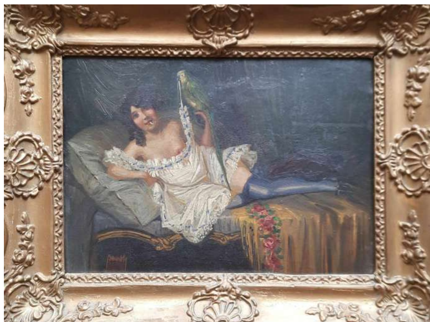
LOTTO 23 FIRMA ILLEGGIBILE (FINE XIX°SEC.) BASE D'ASTA 250,00 DIPINTO OLIO SU CARTONE RAFF. FIGURA FEMMINILE SDRAIATA CON PAPPAGALLO MIS. 25 X 34 FIRMATO IN BASSO A SINISTRA