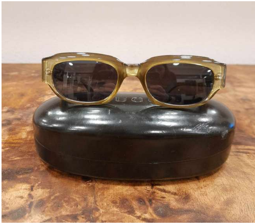
LOTTO 52 GUCCI BASE D'ASTA 130,00 OCCHIALI DA SOLE CON MONTATURA VERDE CORREDATI DA CUSTODIA