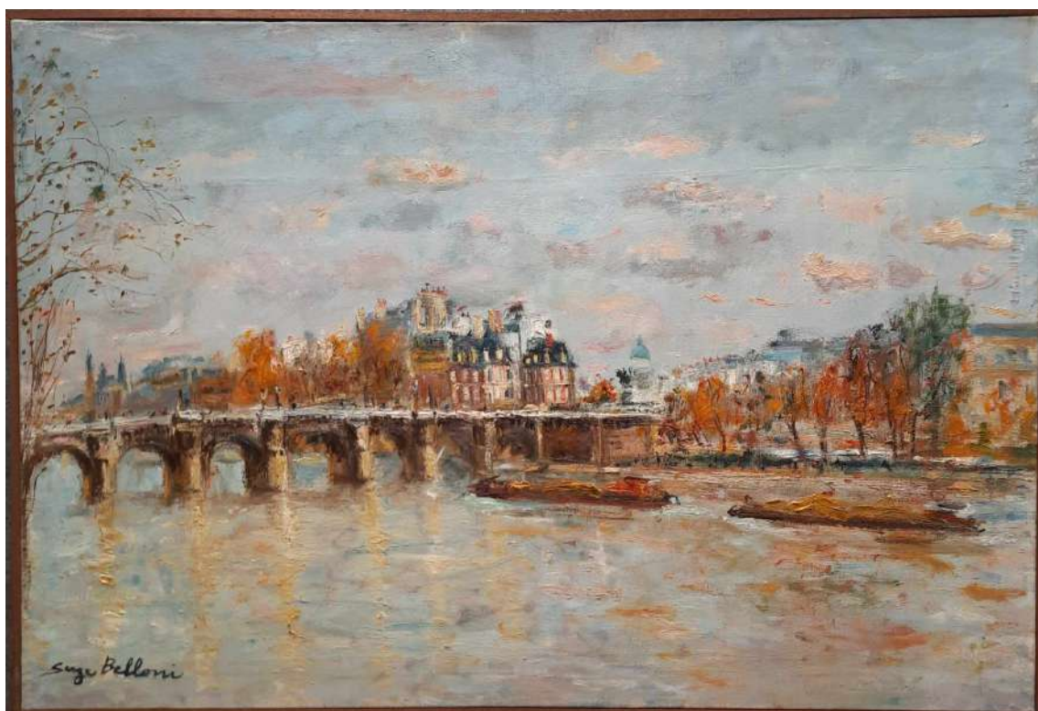
LOTTO 61 SERGE BELLONI (1925 – 2005) BASE D'ASTA 450,00 DIPINTO OLIO SU TELA RAFF. PONT NEUF A PARIGI MIS. 54 X 81 FIRMATO IN BASSO A SINISTRA