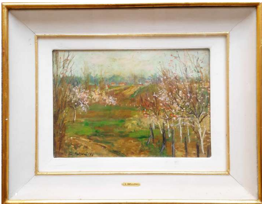
LOTTO 12 SERGE BELLONI (1925 – 2005) BASE D'ASTA 150,00 DIPINTO OLIO SU CARTONE RAFF. PAESAGGIO DI CAMPAGNA MIS. 24 X 33 FIRMATO E DATATO 1955 IN BASSO A SINISTRA