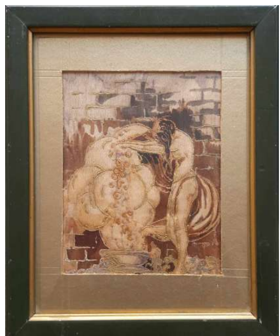
LOTTO 20 ANONIMO (XX°SEC.) BASE D'ASTA 150,00 OPERA DIPINTA SU SETA RAFF. NUDO FEMMINILE MIS. 18 X 14