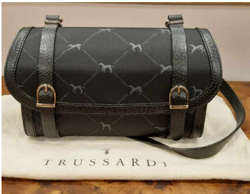
LOTTO 54 TRUSSARDI BASE D'ASTA 250,00 BORSETTA IN SETA E PELLE NERA