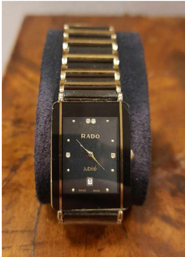
LOTTO 50 RADO BASE D'ASTA 210,00 OROLOGIO DA DONNA AL QUARZO IN ACCIAIO E CERAMICA HIGH - TECH