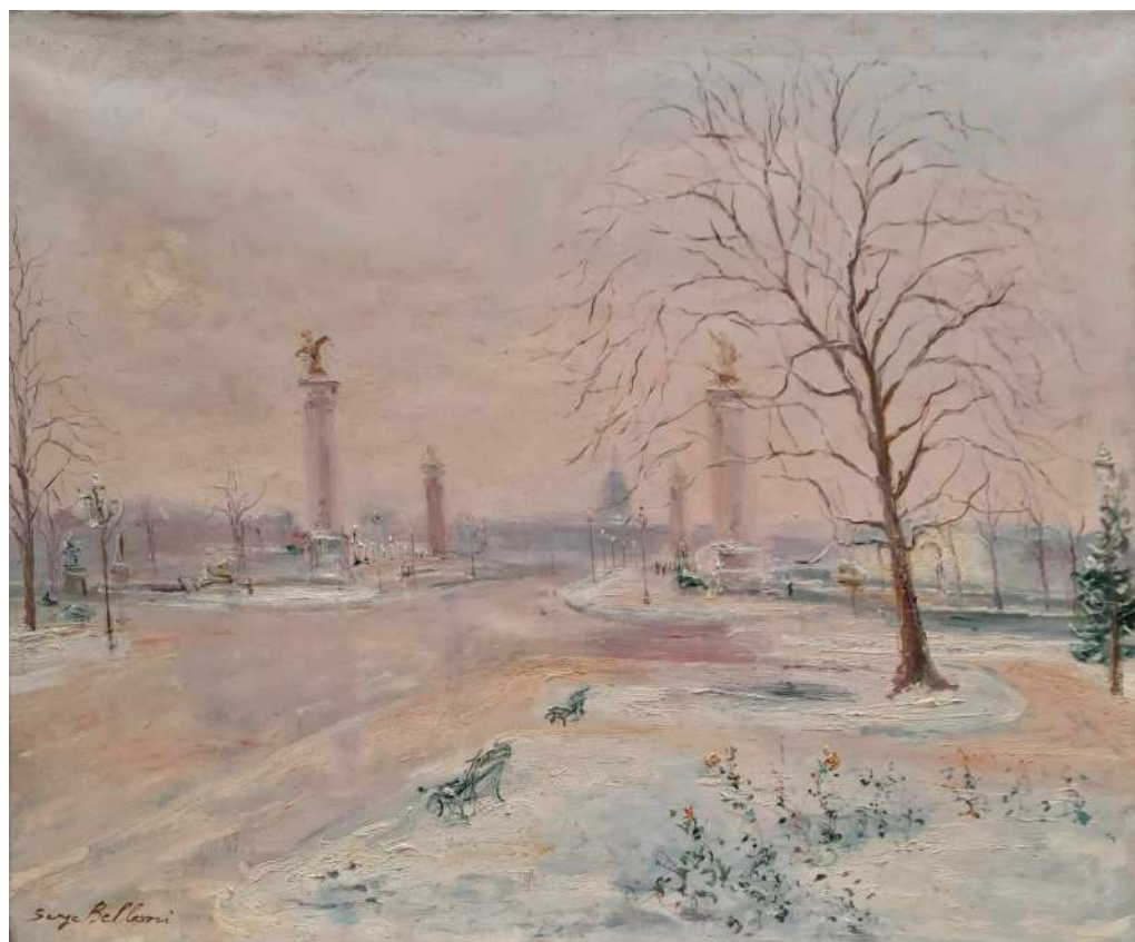
LOTTO 59 SERGE BELLONI (1925 – 2005) BASE D'ASTA 450,00 DIPINTO OLIO SU TELA RAFF. PONTE ALESSANDRO III° A PARIGI MIS. 60 X 73 FIRMATO IN BASSO A SINISTRA