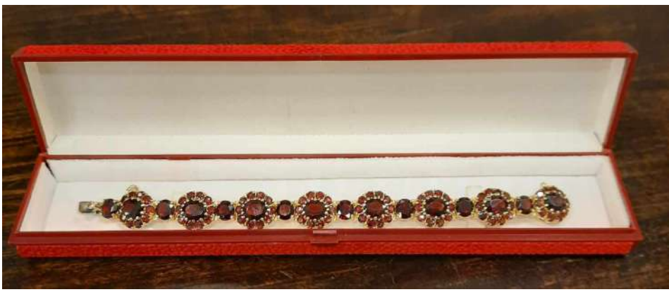
LOTTO 49 ITALIA ANNI 50 BASE D'ASTA 3.500,00 BRACCIALE IN ORO 18 KT. CON GRANATE ROSSE