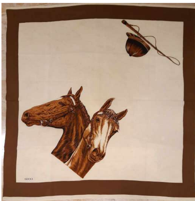
LOTTO 42 GUCCI BASE D'ASTA 140,00 FOULARD IN SETA