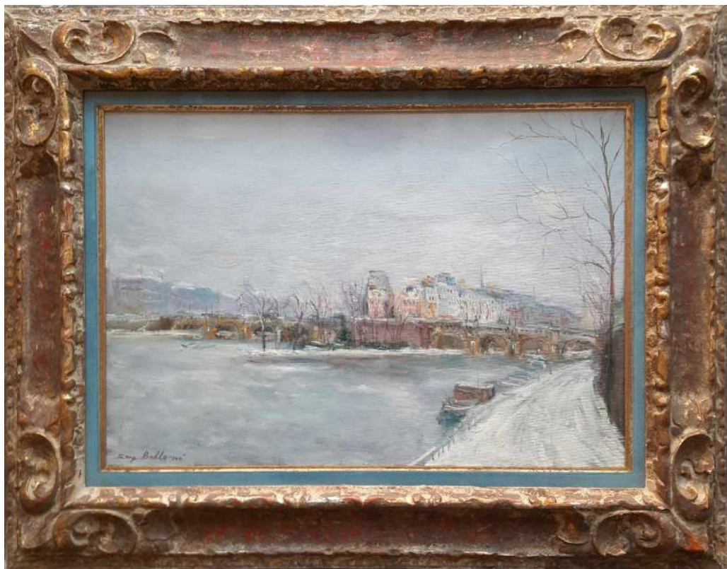
LOTTO 58 SERGE BELLONI (1925 – 2005) BASE D'ASTA 400,00 DIPINTO OLIO SU TAVOLA RAFF. ILE SAINT - LOUIS A PARIGI MIS. 41 X 61 FIRMATO IN BASSO A SINISTRA