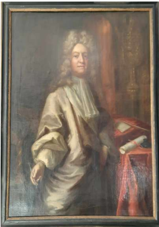
LOTTO 14 MICHAEL DAHL (1659 – 1743) BASE D'ASTA 600,00 DIPINTO OLIO SU TELA RAFF. RITRATTO DI CHARLES MONTAGU - CONTE DI HALIFAX MIS. 120 X 94