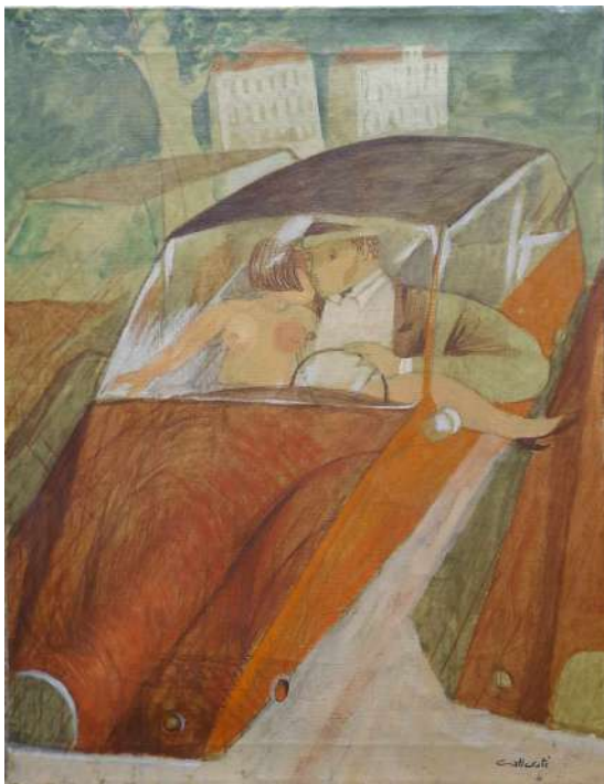
LOTTO 17 ALBERTO GALLERATI (1945) BASE D'ASTA 250,00 DIPINTO OLIO SU TELA INTITOLATO "FORSE NELLA PUNTO MA FORSE NEMMENO" MIS. 50 X 40 FIRMATO IN BASSO A DESTRA