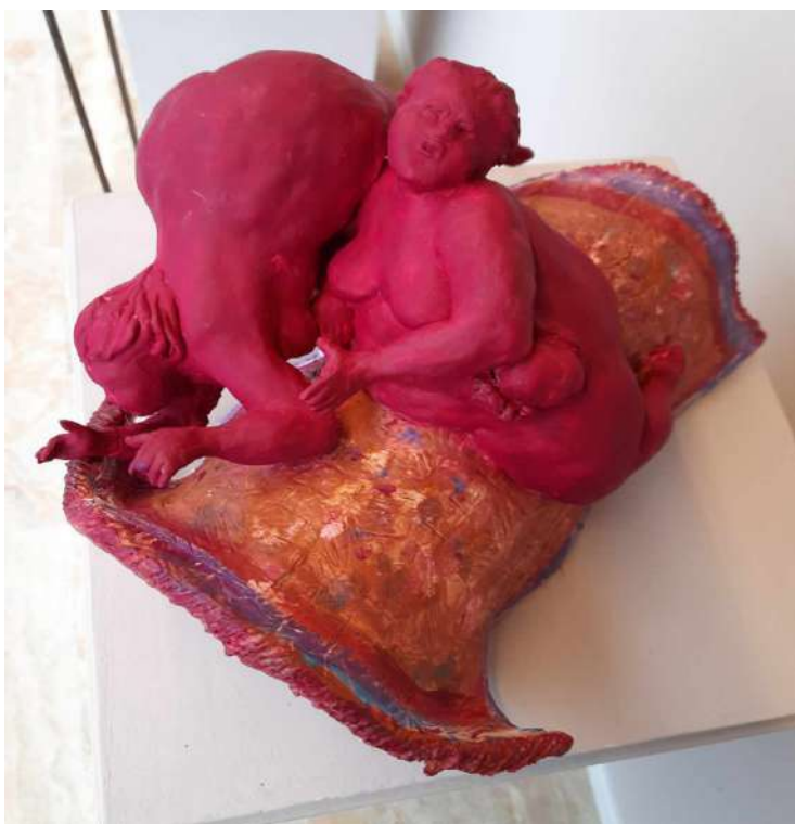
LOTTO 37 PAOLA FOPPIANI (1966) BASE D'ASTA 980,00 SCULTURA IN TERRACOTTA RAFF. TAPPETO VOLANTE H. 20 MIS. 34 X 32