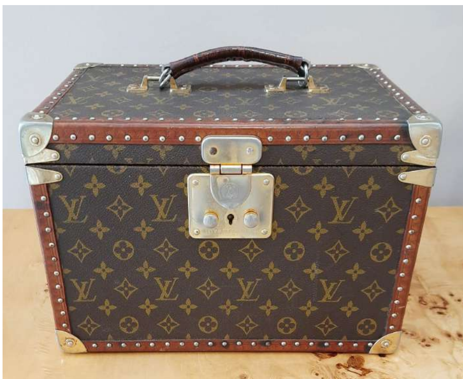
LOTTO 51 LOUIS VUITTON BASE D'ASTA 1.400,00 BEAUTY RIGIDO MONOGRAM PARIGI ANNI 80 (MANIGLIA DA RIPARARE)