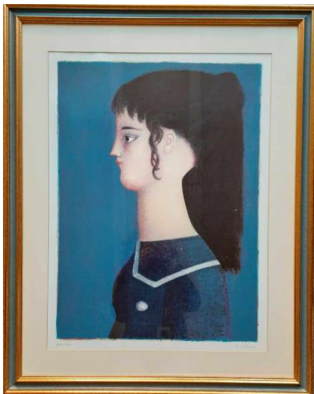
LOTTO 06 ANTONIO BUENO (1918 – 1984) BASE D'ASTA 100,00 LITOGRAFIA RAFF. PROFILO DI RAGAZZA MIS. 73 X 55 SIGLATA 7 / 25 FIRMATA IN BASSO A DESTRA