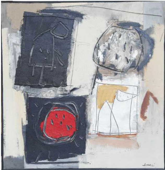
LOTTO 04 GIANFRANCO ASVERI (1948) BASE D'ASTA 2.800,00 DIPINTO TECNICA MISTA SU TELA INTITOLATO "COMPOSIZIONE 1990" MIS. 80 X 80 FIRMATO IN BASSO A DESTRA