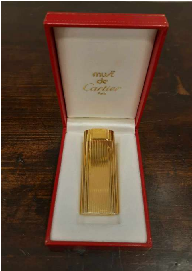
LOTTO 39 CARTIER BASE D'ASTA 280,00 ACCENDINO PLACCATO ORO 18 KT. CORREDATO DA CERTIFICATO DI GARANZIA