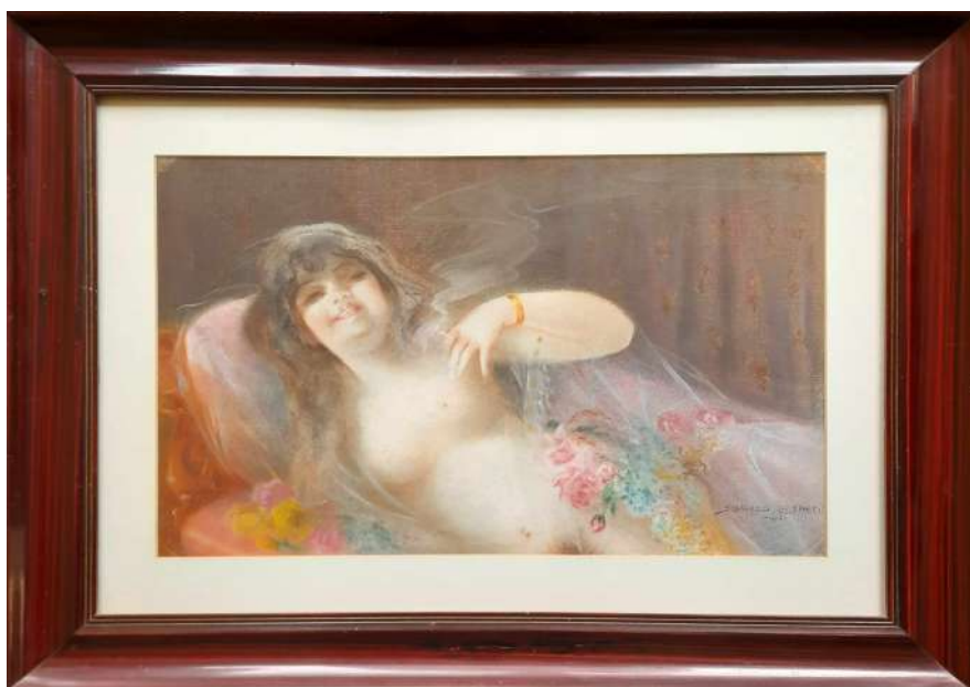
LOTTO 24 ALFREDO SBAFFO (INIZI XX°SEC.) BASE D'ASTA 250,00 DISEGNO PASTELLI SU CARTA RAFF. NUDO FEMMINILE CON FIORI MIS. 30 X 46 FIRMATO E DATATO 1915 IN BASSO A DESTRA